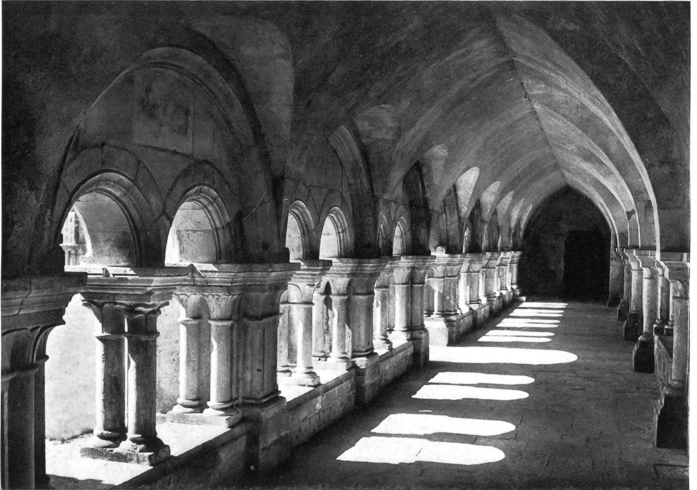
Kreuzgang der Abtei Fontenay