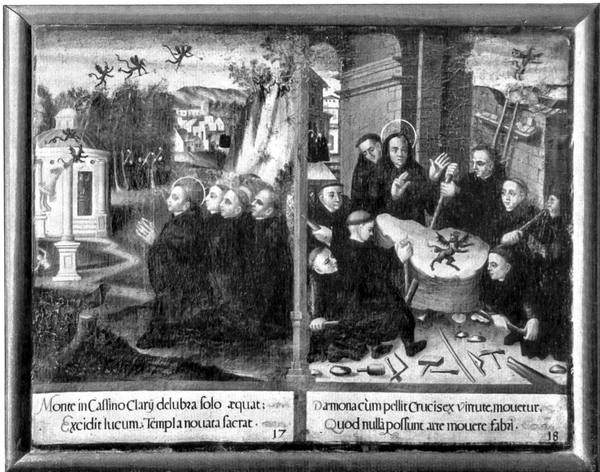
Tafel 17/18 St. Benedikt kämpft gegen Götzen und Dämonen