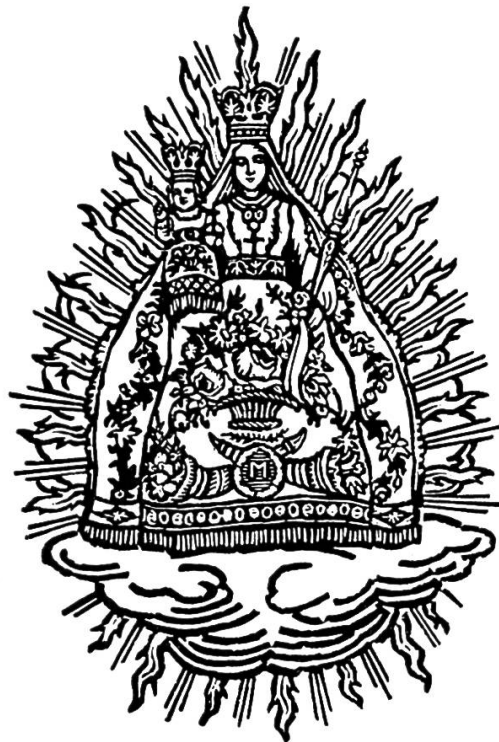
Unsre liebe Frau im Stein

Es kommt ein Schiff geladen Auf einer stillen Woge bis an sein höchsten Bord, kommt uns das Schifflein, bringt uns den Sohn des Vaters, es bringt uns reiche Gabe bringt uns das ewig Wort. die hehre Königin.