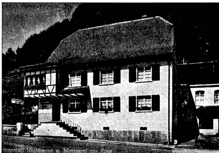
Restaurant, Kaffeehaus u. Metzgerei zur Rose