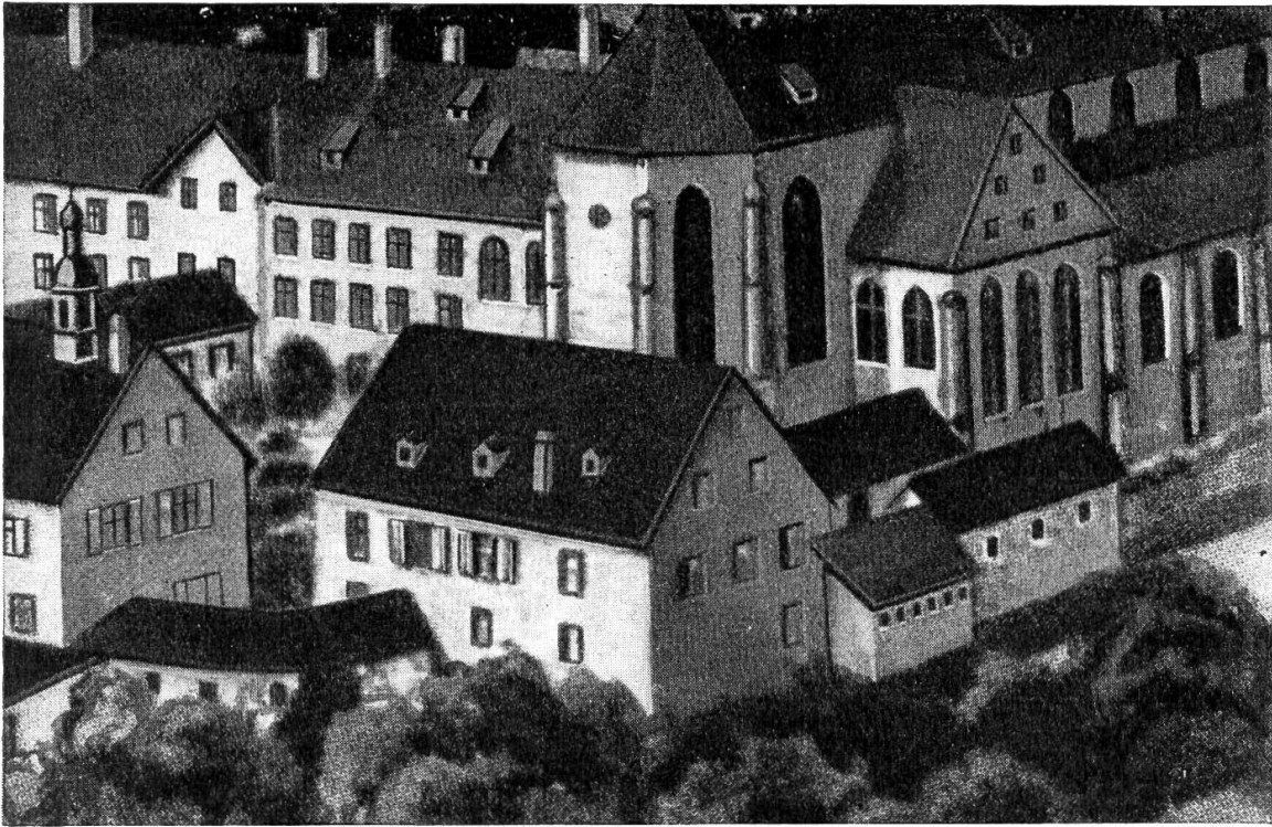
Das Schulhaus hinter dem Chor der Kirche