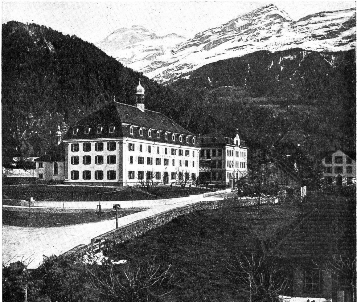
Kollegium in Altdorf

Und nun zum Schluß eine Frage, die sich aufdrängt. Solothurn besitzt in der Kantonschule eine höhere Lehranstalt, deren Schülerzahl zu einem großen Teil aus der Hauptstadt und dem obern Kantonsteil sich rekrutiert. Der untere Teil des Kantons strebt seit Jahren nach einem Gymnasium mit wenigsten vier Klassen in Olten. Und nun der dritte Kantonsteil, das Schwarzbubenland? Nehmen wir einmal an, das Kloster-gymnasium in Mariastein wäre, statt daß es bedrängt wurde, von oben unterstützt und gehoben worden — — Nein, nehmen wir an, man hätte (nachdem man das Kloster und seine Schule, wie man es tatsächlich getan, ständig bedrängt und schließlich zugunsten der übrigen Schulen des Kantons aufgehoben) einzig und allein — wie die Vertreter des Schwarzbubenlandes, als die Aufhebung bereits beschlossen war, noch als Letztes baten — den Konventualen von Mariastein, den Schweizer- und Kantonsbürgern, gestattet, in dem nachher leerstehenden und zerfallenden Klostergebäude beisammenzuleben: ein wie glänzendes und ein wie billiges und dem Volkscharakter durchaus entsprechendes Gymnasium — der Blick auf Delle und Altdorf zeigt es unwiderleglich — könnte das Schwarzbubenland heute haben!