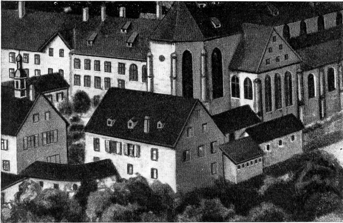
Das Schulhaus hinter dem Chor der Kirche

murde aus den Gemächern unter der Abtmohnung in den freundlicheren ersten Stock des Gebäudes hinter dem Chor der Kirche verlegt. Ein bleibender Theatersaal wurde eingerichtet. Nicht genügend vorbereitete Zöglinge wurden einem „Vorkurs“ zugewiesen. 1828 wurde die griechische Sprache eingeführt und die Grammatik dem Deutschunterricht angegliedert. Fähige Lehrer, wie P. Hieronymus Ziegler, P. Ignaz Stork und andere widmeten sich mit aller Hingebnng dem Unterricht. Die Schülerzahl betrug in den dreißig. Die Klosterschule war in vielversprechendem Aufstieg begriffen.