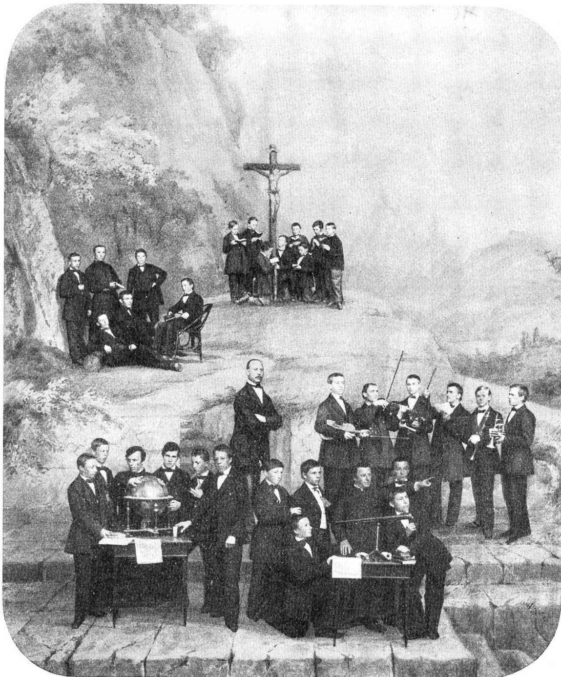
Ein Bild aus der Mariastein-Schule

gen. Der Versuch, die notwendigen Geldmittel, durch eine direkte Steuer zu beschaffen, hätte den Fall der Regierung bedeutet. Aber man habe ja „vergrabene Talente“ in den Klöstern, ihre „Umgestaltung“ in moderne Verhältnisse, in Schulen, sei einzig eine „Frage der Zweckmäßigkeit“, erklärten die Jungen. Der „Klosterlärm“ erfüllte wieder den ganzen Kanton. Angesichts der Volksstimmung ließ man vom Gedanken der Aufhebung abermals für einmal ab; hingegen sollte das Geld durch „schrittweise Maßnahmen“ aus den Klöstern herausgeholt werden. Die Not zwingt dazu. Man solle nicht gescheiter sein, als die Bienen, welche den Honig zusammentrügen, die Drohnen aber, die nur fressen und nicht