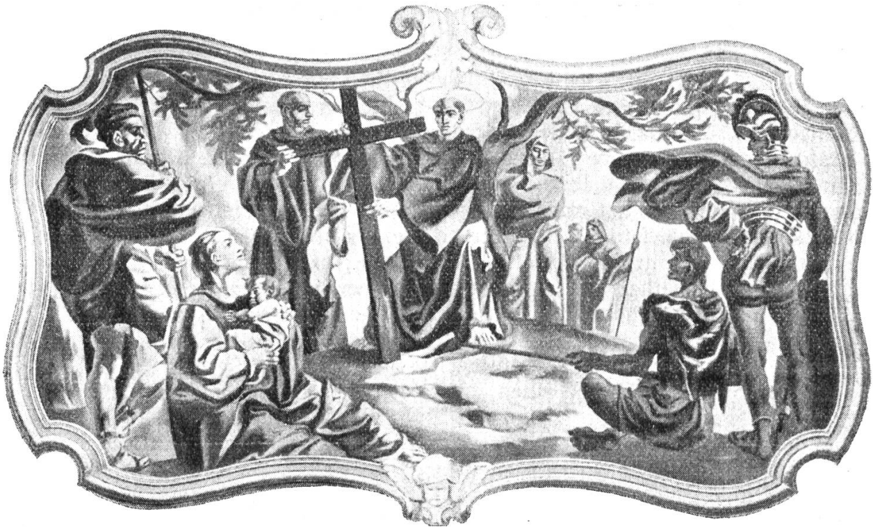
St. Benedikt predigt das Evangelium

her und besonders noch aus seiner Vaterstadt und Rom eilen ihm Jünger zu. Es kamen Landleute, Handwerker, Künstler, Geistliche, die sich vor den neuen arianischen Herren des Landes in die Einöde zurückzogen; es kamen Bürger und Patrizier; Freie und Unfreie, sie alle wollten unter St. Benedikts weiser Leitung dem ewig herrlichen Ziele entgegen eilen.