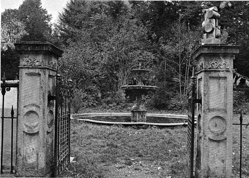
Die Gartenanlage in Neuthal.