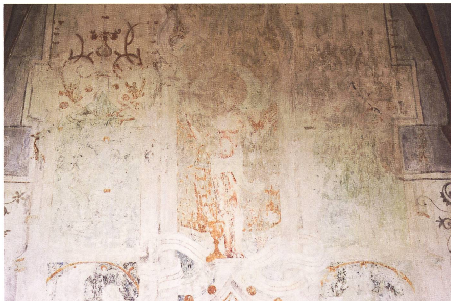
Abb. 4: Aufgemalte Ornamente akzentuieren die farbig gefassten Gewölberippen und das Läuterfenster an der Turmwand. (Kantonale Denkmalpflege Zürich, Dübendorf)

Abb. 3: Oberhalb der Tabernakelnische ist eine Konsole mit der Figur Christi gemalt. (Kantonale Denkmalpflege Zürich, Dübendorf)