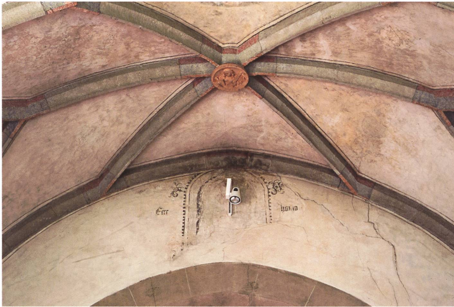
Abb. 5: Blick ins Gewölbe gegen den Chorbogen: Die farbig gefassten Rippen, der skulptierte Schlussstein mit der Darstellung der heiligen Petronella und die nur teilweise ausgeführten Malereien waren als gestalterische Einheit konzipiert. (Kantonale Denkmalpflege Zürich, Dübendorf)

mit Bleistift skizzierten Gestalten und Ornamente verschwanden für rund 450 Jahre unter weisser Tünche.» 7 Betont vorsichtig äusserte sich hingegen der Kunstdenkmäler-Inventariseur Hans Martin Gubler: Wände und Gewölbe seien für eine Gesamtausmalung vorbereitet, worden, «die aber – die Gründe sind nicht bekannt – unvollendet liegen gelassen wurde». 8