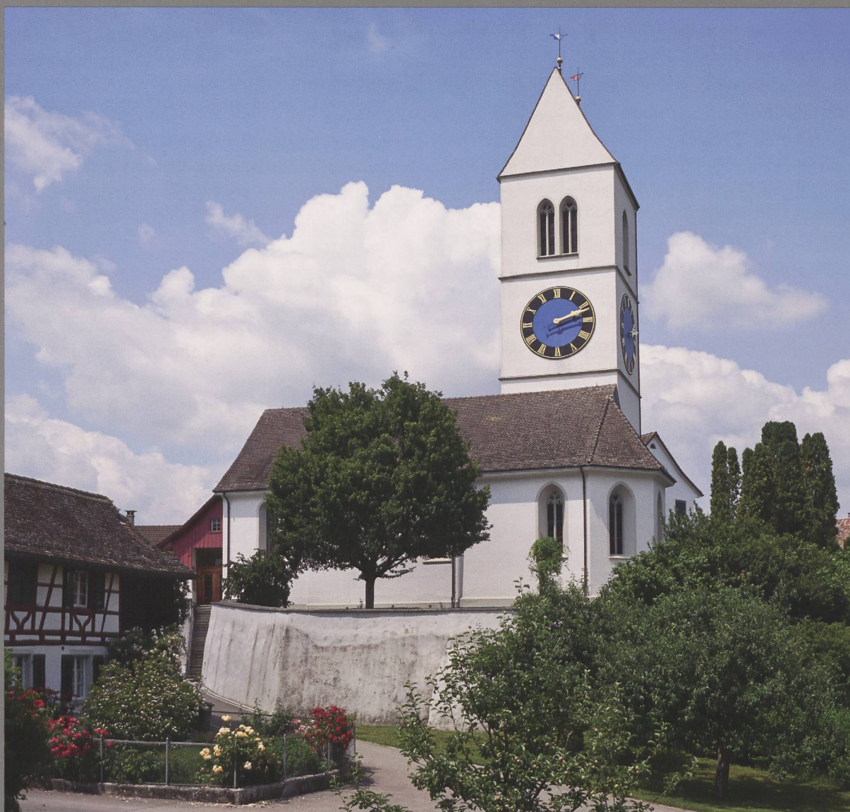
Abb. 1: Die leicht erhöht gelegene Kirche von Dinhard mit ihrem schlanken Turm wirkt noch heute beeindruckend.