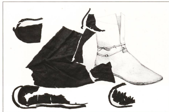
Aus einer Latrine an der Dorfstrasse stammen Lederfragmente von vier Schuhen des 12./13. Jahrhunderts. Ein bis zur Wade reichender Schuh der Grösse 43–44 ist fast vollständig erhalten. (Kantonsarchäologie Zürich, Martin Bachmann; Zeichnung: Marquita Volken, Gently Craft, Lausanne)

Schuhe des 12./13. Jahrhunderts enthielt. 6 Die Machart der Schuhe weist auf wohlhabende Besitzer hin, die zum Umfeld der Kyburg passen.