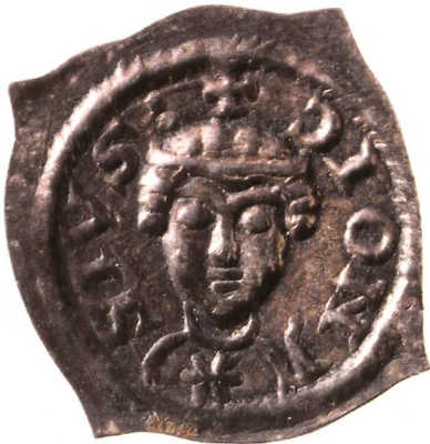
Kyburger Pfennig: Grafen von Kyburg, Pfennig (um 1260), Münzstätte Diessenhofen. Kopf des heiligen Dionysius mit Stirnbinde, darüber Kreuz; Umschrift DIONISIVS. Aus dem Schatzfund von Winterthur-Holderplatz, gefunden 1970. (Münzkabinett Schweizerisches Nationalmuseum, Inv.Nr. AZ 3617)

In der Ostschweiz gehörten zu den neuen Münzherren in erster Linie die Grafen von Toggenburg mit einer Pfennigprägung in Lichtensteig oder Konstanz (?) um 1240, 62 die Grafen von Montfort mit einer Münzprägung in Feldkirch um 1250/70, 63 die Abtei St. Georgen in Stein am Rhein um 1230 64 und schliesslich die Abtei Rheinau um 1260/80 (?), 65 die sich vielleicht als Einzige auf eine königliche Privilegierung stützte.