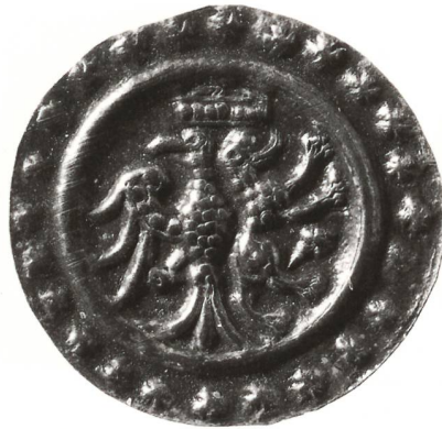
Pfennigprägungen aus der Zeit des Interregnums: a) Abtei St. Gallen, Pfennig (um 1240), Münzstätte St. Gallen (oder Konstanz?). Stehendes Lamm nach links, dahinter Krummstab; Kreuz-Viereck-Rand. b) Grafen von Toggenburg, Pfennig (um 1240), Münzstätte Lichtensteig (oder Konstanz?). Links gerichteter halber Adler und rechts gerichteter Hund, darüber Krone; Kreuz-Viereck-Rand. (Münzkabinett Schweizerisches Nationalmuseum, Inv Nr. +A 3631 und M 3066)

erhielt 999 ein für Allensbach verliehenes Münzrecht.