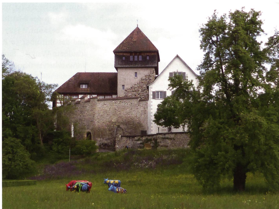
Der stark restaurierte Unterhof in Diessenhofen. (Peter Niederhäuser, 2014)

wesen wird die Stadt jedenfalls bereits 1230 mit der Nennung von Schultheiss («scultetus») und Bürgern («nomina civium») sichtbar. 1252 erscheint erstmals das Siegel des Rats auf einer Urkunde, und 1254 schloss der Rat selbständig ein Rechtsgeschäft ab. Bürger und Schultheiss werden in den 1240er- und 1250er-Jahren als Zeugen in kyburgischen Urkunden genannt und belegen die Nähe von Stadtherr und Stadt. 107 Allerdings lässt die Zerstörung einer nicht lokalisierbaren Stadtburg oberhalb der Stadt vor 1264 einen nicht näher fassbaren, akuten Konflikt zwischen Stadtbürgern und Stadtherrn vermuten, dessen Beilegung wohl im Umfeld des Stadtrechtsprivilegs von 1264 erfolgte. 108