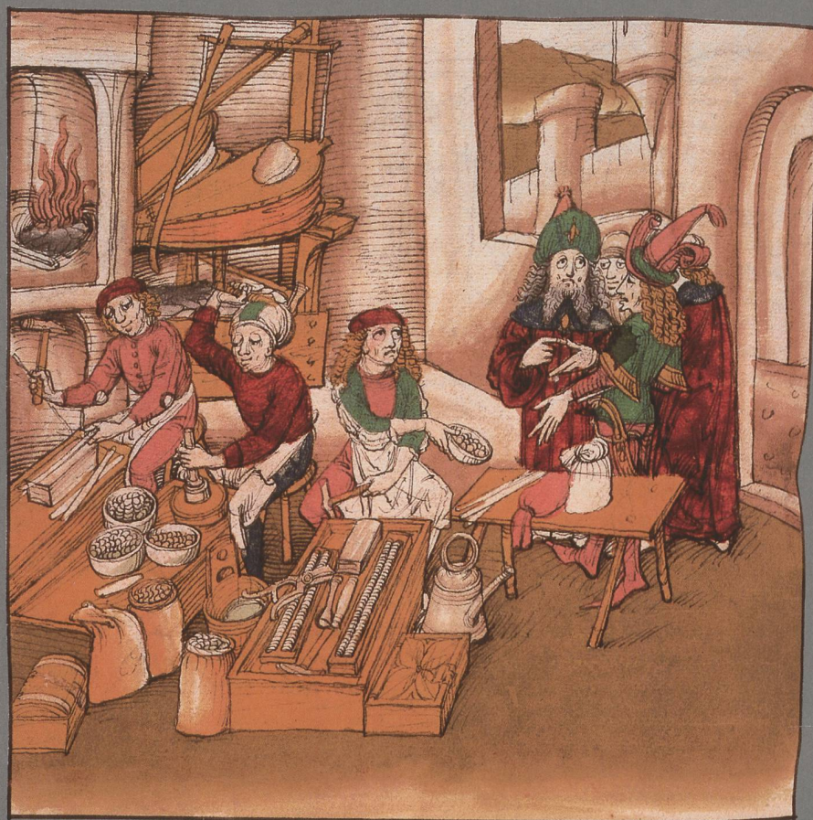
Der Graf von Kyburg lässt schlechte Münzen schlagen: Darstellung der Münzstätte aus der Spiezer Chronik von Diebold Schilling (1484/85). (Burgerbibliothek Bern, Mss. hist. helv. I. 16, S. 222)