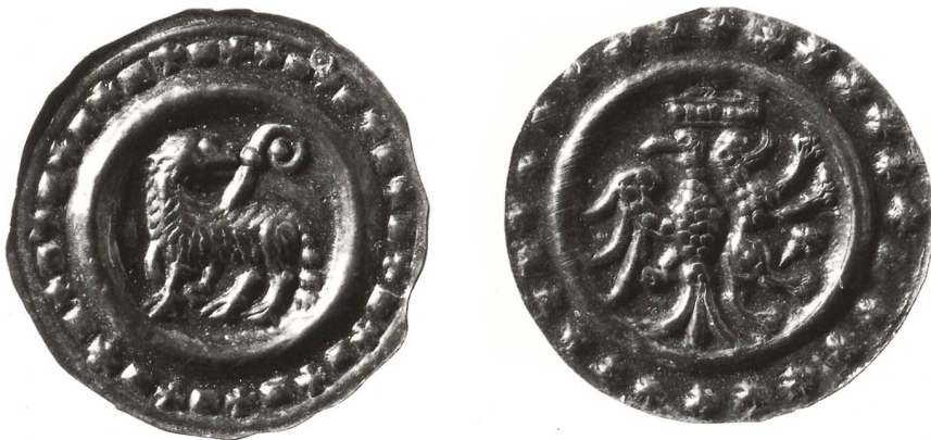
Pfennigprägungen aus der Zeit des Interregnums: a) Abtei St. Gallen, Pfennig (um 1240), Münzstätte St. Gallen (oder Konstanz?). Stehendes Lamm nach links, dahinter Krummstab; Kreuz-Viereck-Rand. b) Grafen von Toggenburg, Pfennig (um 1240), Münzstätte Lichtensteig (oder Konstanz?). Links gerichteter halber Adler und rechts gerichteter Hund, darüber Krone; Kreuz-Viereck-Rand. (Münzkabinett Schweizerisches Nationalmuseum, Inv Nr. +A 3631 und M 3066)

erhielt 999 ein für Allensbach verliehenes Münzrecht.