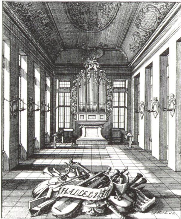
Abb. 8: Musiksaal von 1716/17. Inneres mit der Orgel von 1684. (Abegg/Barraud Wiener, Kunstdenkmäler Zürich II.I, S. 125)

Das Jahrhundert endete für die ganze Stadt dramatisch. Das Fraumünster wurde während der französischen Belagerung ausgeräumt und diente als Heumagazin und Truppenunterkunft; später nutzten die Russen den Raum für den orthodoxen Gottesdienst. Das Grossmünster blieb unbehelligt.