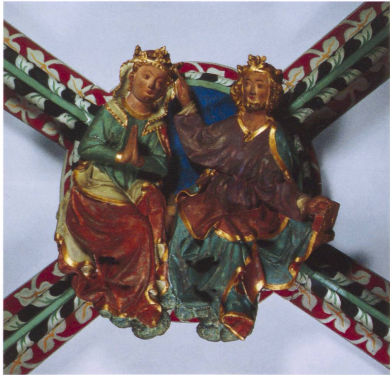
Abb. 4: Marienkrönung. Schlussstein aus dem Vierungsgewölbe des Querhauses. Um 1300. (Abegg/Barraud Wiener, Kunstdenkmäler Zürich II.I, Titelbild)