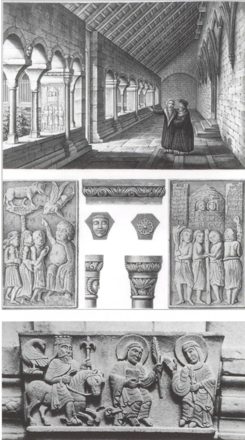
Abb. 2: Blick in den Nordflügel des Kreuzgangs mit den Pfeilerreliefs, welche die vom Fraumünster beanspruchte Geschichte resümieren.