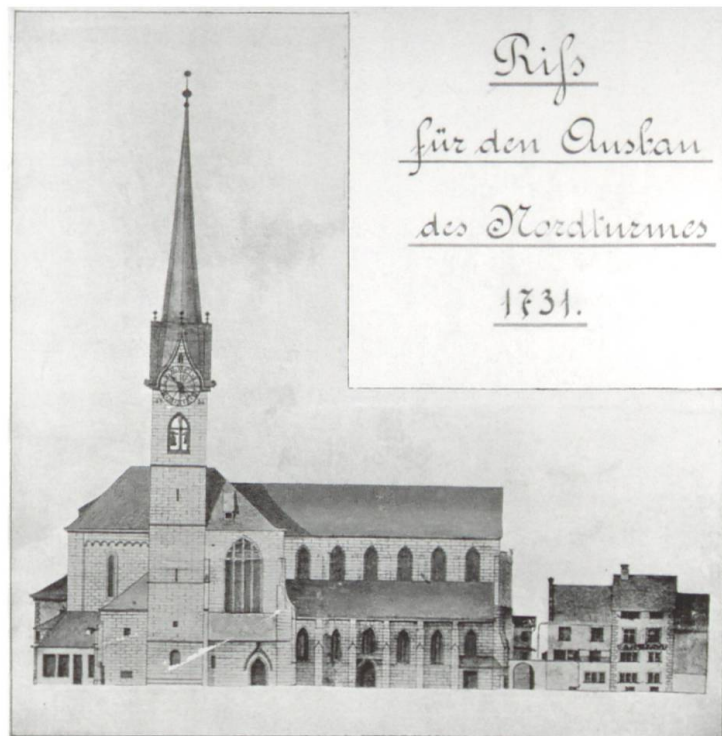
Abb. 9: Fraumünster von Norden nach der Umgestaltung 1728/31.

Die Eingemeindung von 1893 liess die Aufgaben und Ansprüche der Stadtverwaltung sprunghaft anwachsen. 1898 wurden die ehemaligen Konventbauten und der Kreuzgang beim Fraumünster abgerissen. An ihrer Stelle entstand 1898–1900 das Stadthaus von Gustav Gull. Die Konsequenzen, welche dies für die Kirche hatte – der fehlende Zugang zur Empore, aber auch der Kontrast zwischen dem neuen, «zierlichen» Stadthaus und dem beschämenden Zustand der Kirche –, lösten jenen prägenden Umbau aus, der diesmal ein Joint Venture von Kanton und Kirchgemeinde war. 36 Das gemeinsame Wagnis führte über Umwege zu dem uns heute vertrauten Resultat, wenn wir von den bunten Glasfenstern von Augusto Giacometti und Marc Chagall absehen, die heute bekanntlich eine grosse Anziehungskraft ausüben. 1912 ging die Kirche, seit der Reformation Staatsbesitz, ganz an die Kirchgemeinde über.