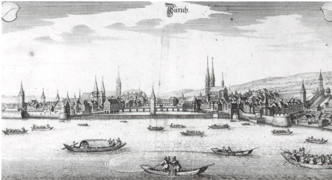
Abb. 1: Links und rechts der Limmat. Fraumünster und Grossmünster flankieren mit ihren Türmen den Eingang zur Stadt vom See her. Johann Caspar Nüscheler/Matthäus Merian, 1644. (Baugeschichtliches Archiv der Stadt Zürich)

Rolle spielten, genau deshalb das auf der gegenüberliegenden Seite stehende Grossmünster wählten, um ihre Stellung in Zürich zu manifestieren; das Fraumünster mochte für sie noch immer Tabuzone sein. So bezeichnen denn die aus dem zweiten und dritten Viertel des 10. Jahrhunderts stammenden Teile des Grossmünster-«Rotulus» 9 die Herzoge als «seniores nostri» und erheben sie auf die gleiche Stufe wie Felix, Regula und Karl den Grossen; eine familiäre Verbindung wurde hier nie in Anspruch genommen.