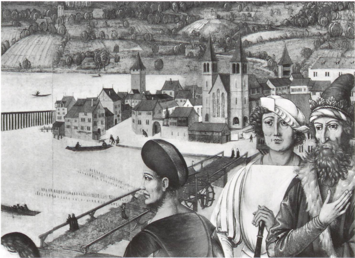
Abb. 5: Das Fraumünster mit den Abteigebäuden von Nordosten. Ausschnitt aus der Altartafel von Hans Leu dem Älteren um 1500 aus dem Grossmünster. (Abegg/Barraud Wiener, Kunstdenkmäler Zürich II.I, S. 65)

Werkbetrieb Teile des günstig gelegenen Areals am See in Anspruch, 1536 wurde ein ehemaliges Chorherrenhaus zum Werkmeisterhaus umgebaut. Im Äbtissinnenhof, der ja erst wenige Jahrzehnte alt war, erfolgten Umbauten erst, nachdem Katharina von Zimmern längst ausgezogen war und 1536 auf ihren Anspruch auf ein Wohnrecht formell verzichtet hatte. 33 Die privaten Räume der Äbtissin wurden für den Amtmann hergerichtet, im zweiten Geschoss wurde das Alumnat, eine Internatsschule, installiert. In den Räumen der kleinen Klosterschule, die Katharina schon vor der Reformation hatte einrichten lassen, waren keine Anpassungen nötig. 1537–1539 entstand ein neues «Früchtehaus» an der Südseite des Klosters. Dass der Prozess auch den Münsterhof ergriff, der 1542 vom Werkbetrieb frei geräumt werden musste, ist vielleicht ein Hinweis darauf, dass dieser immer noch als klösterliches Areal galt.