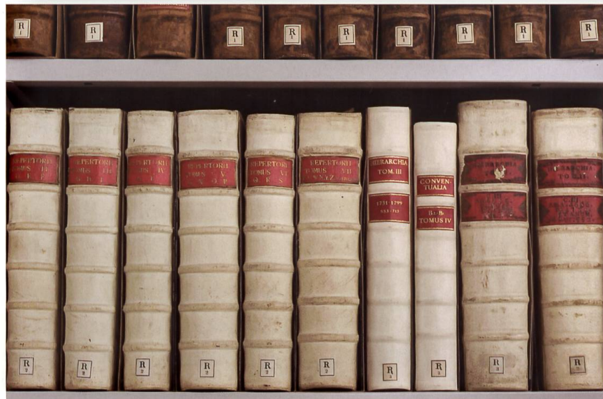
Die «Repertoria Archivii Rhenaugienis» (R 1 und R 2), die «Hierarchia» (R 3) und ein Band der «Conventualia» (fälschlicherweise mit der Signatur R 3): Anfangsbände des 18. Jahrhunderts der langen Reihe von Findmitteln für das Rheinauer Klosterarchiv.

1803 endgültig dem Kanton Zürich inkorporiert. Damit war die landesherrliche Souveränität des Klosters gebrochen, und 1836 wurde durch ein Novizenverbot und eine faktische Übernahme der Klosterökonomie durch die Zürcher Regierung der Untergang des Stifts vorbereitet. Die Aufhebung verzögerte sich wegen des Epavenrechts, das den Verkauf von Kloster Gütern im Grossherzogtum Baden, wo Rheinau insbesondere das Schloss und Liegenschaften in Ofteringen besass, nicht zulässig. Nach der Streichung dieser Bestimmungen im Jahr 1857 war der Weg für eine gewinnbringende Veräusserung geebnet, und mit der am 3. März 1862 durch den Kantonsrat beschlossenen Klosteraufhebung wurde die Umnutzung des Klosters und die Liquidation von Kloster Gütern eingeleitet. 6