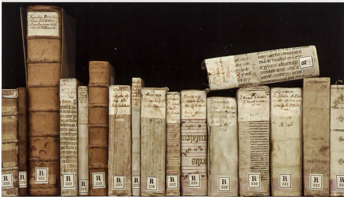
Die Bestände des Rheinauer Archivs sind zwecks Reorganisation vorübergehend im Staatsarchiv Schwyz untergebracht.