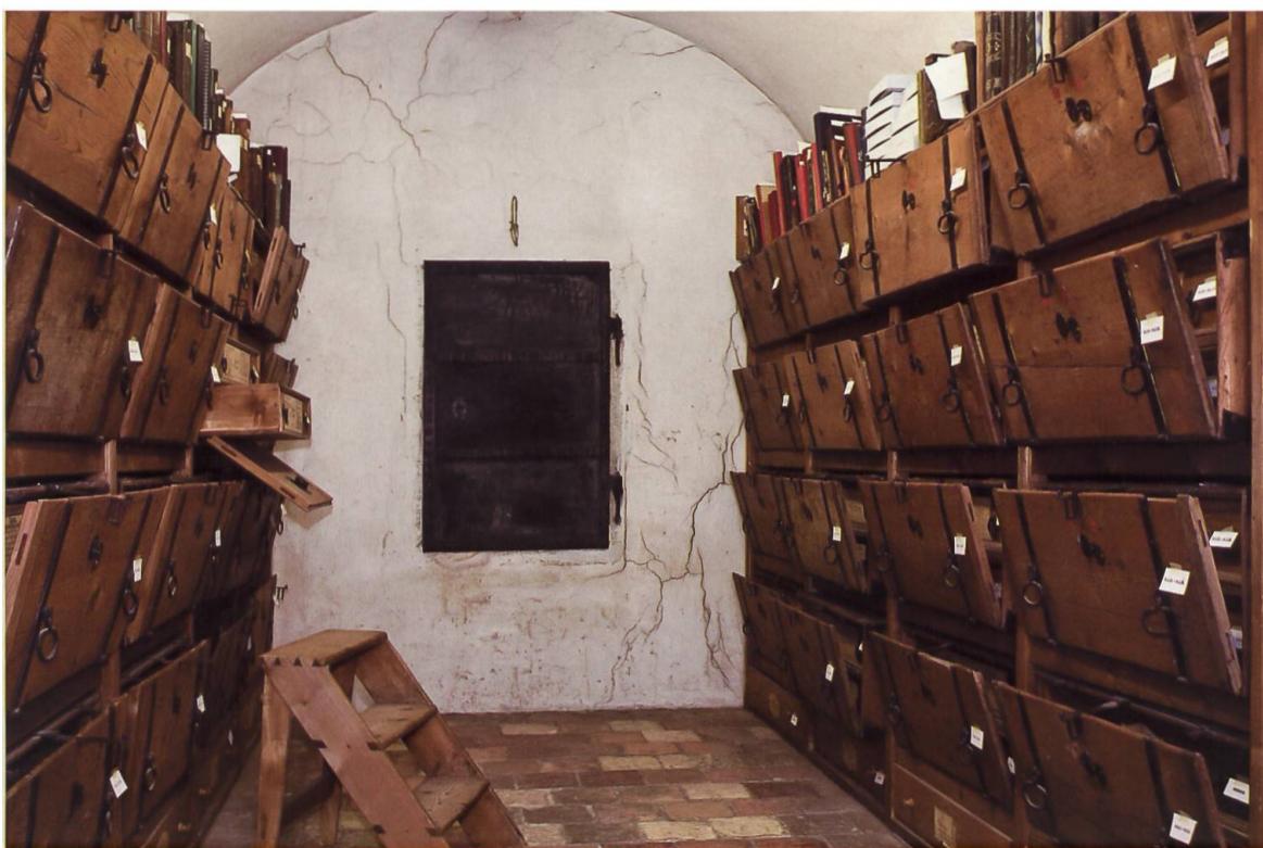
Das Fintanszimmer im Kloster Einsiedeln, wie es sich im letzten Jahrhundert als Rheinauer Archivstube präsentierte. Hinter dem Fintanszimmer befinden sich feuersichere Archivkammern.