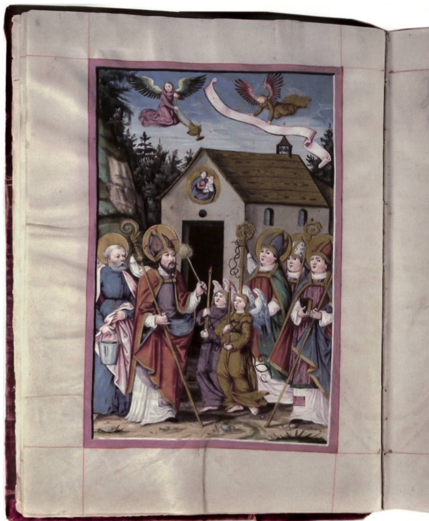
Das Guttäterbuch. Die aufgeschlagene Seite zeigt die Engelweihe in einer Illustration aus dem frühen 16. Jahrhundert. (Klosterarchiv Einsiedeln, A.WD.11)