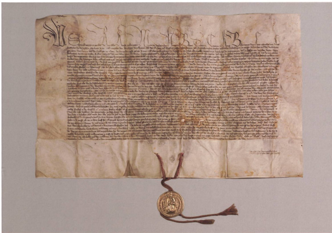
Die goldene Bulle Sigismunds von 1434 für Einsiedeln. (Klosterarchiv Einsiedeln, A.XI.9)

nur Rechte verleihen konnte, über die er von Reichs wegen verfügte, legten die Schwyzer als Abschrift eine differenziertere Umschreibung der Vogteirechte vor. Den Wortlaut entnahmen sie einem Schriftstück der Habsburger, das vermutlich 1415 bei der Eroberung des vorderösterreichischen Archivs in Baden erbeutet worden war. 31 Anfang Dezember 1433, als Sigismund auf dem Weg von der Krönung in Rom in Basel Halt machte, suchten Boten der Schwyzer den Herrscher auf. Am 11. Dezember übertrug der Kaiser die Klostervogtei endgültig den Schwyzern. Diese liessen sich die Rechte mit einer goldenen Bulle besiegeln und brachten damit die Bedeutung des kaiserlichen Briefes und den Sieg über den Einsiedler Abt auch symbolisch zum Ausdruck.