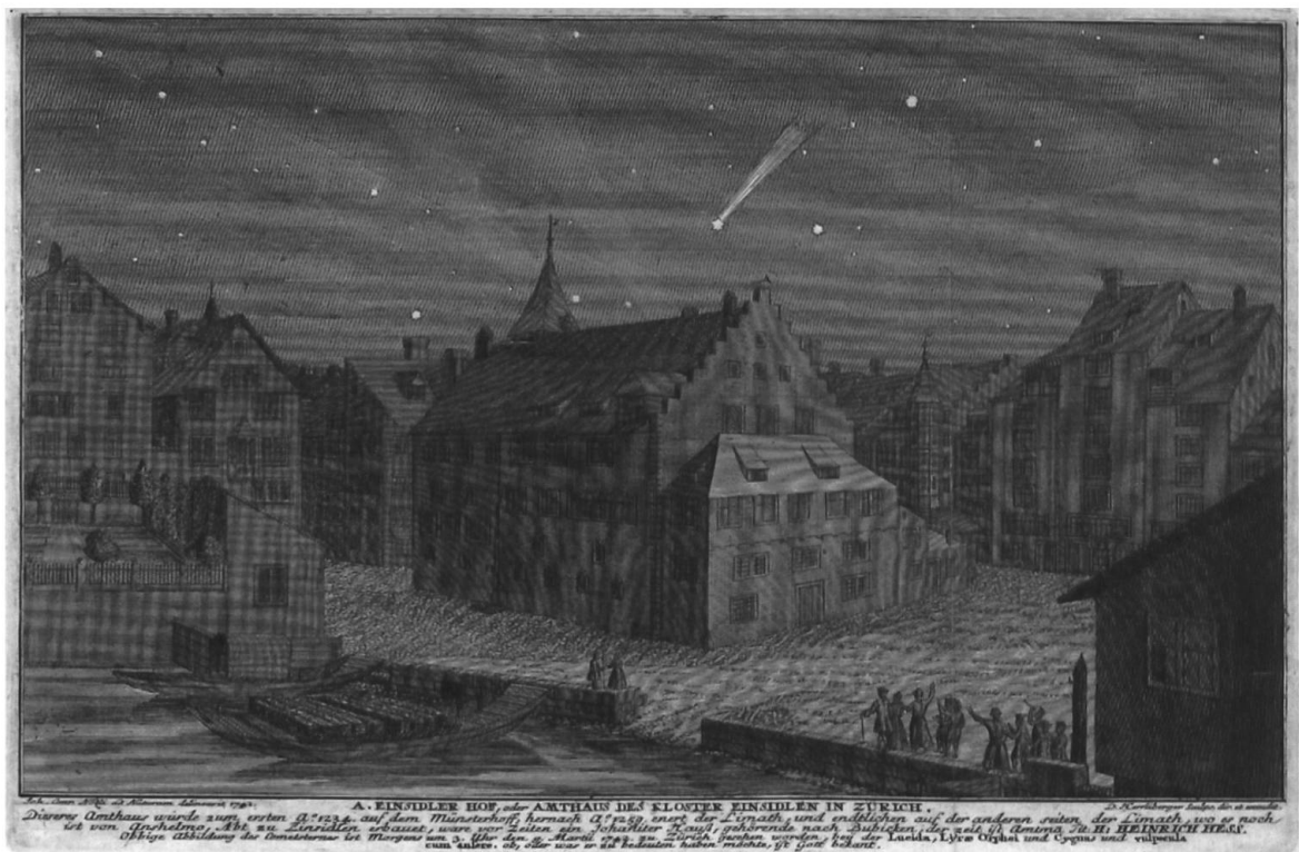
Einsiedlerhof mit dem Kometen vom 9. März 1742, gezeichnet von Johann Conrad Nözli, gestochen von David Herrliberger. (Zentralbibliothek Zürich, Graphische Sammlung)