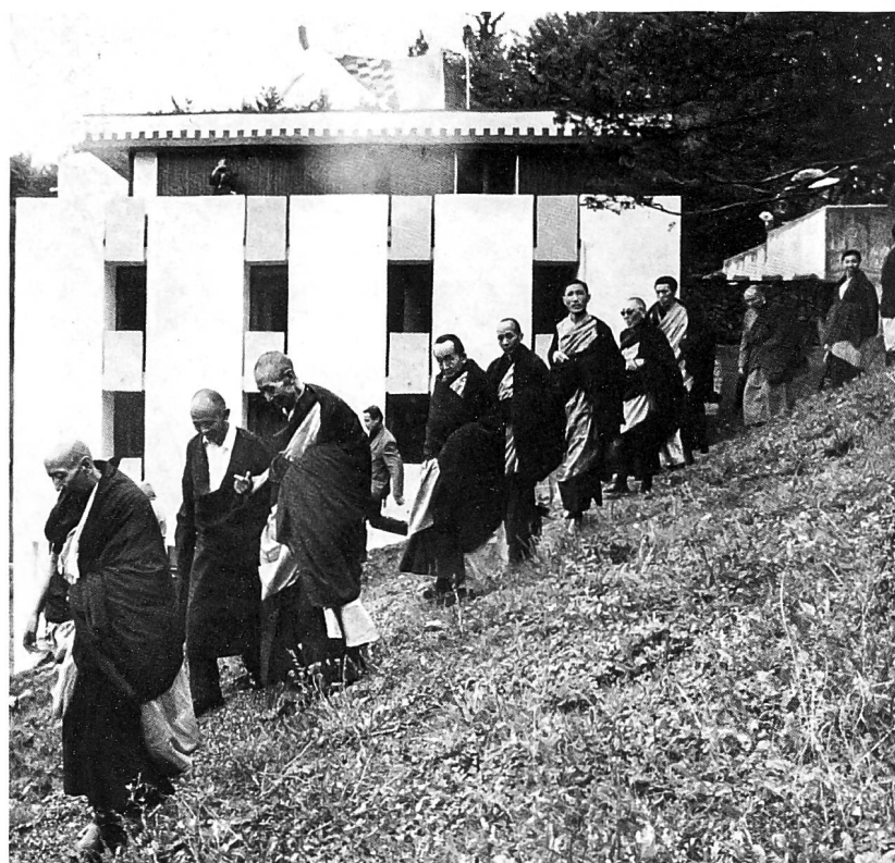
Das Tibet-Institut Rikon kurz nach der Eröffnung; bei der Einweihung wurde der rituelle Umgang von den beiden Geistlichen Hauptlehrern des Dalai Lamas angeführt, die eigens aus Indien angereist waren.