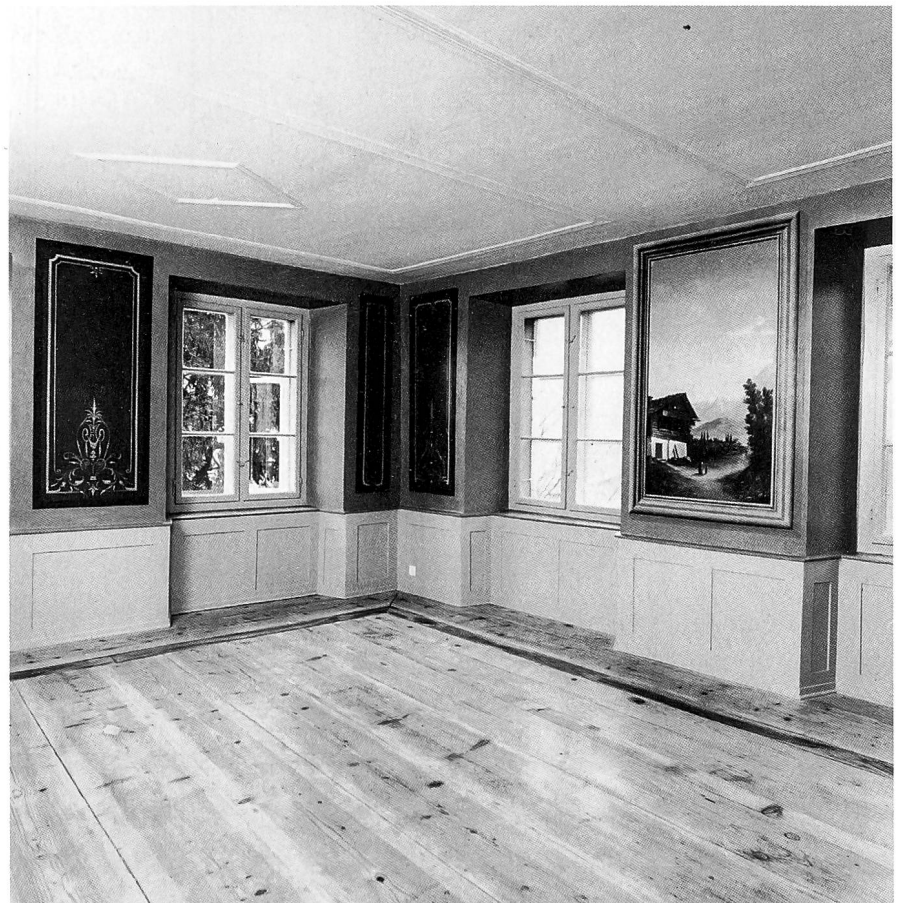
Ansicht von Hütten, gezeichnet von Heinrich Keller (1778–1862) im August 1856. «Bär», «Krone» und «Kreuz», die drei grössten Wohngebäude des Ortes, sind mit Buchstaben gekennzeichnet. Der Saal im ersten Obergeschoss der ehemaligen Dependence des «Bären» mit Wandbildern des aus Kiel stammenden Malers Julius Theodor Gischard aus der Zeit um 1880. Aufnahme 1989.