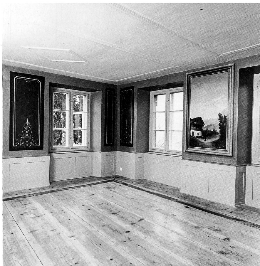
Ansicht von Hütten, gezeichnet von Heinrich Keller (1778–1862) im August 1856. «Bär», «Krone» und «Kreuz», die drei grössten Wohngebäude des Ortes, sind mit Buchstaben gekennzeichnet. Der Saal im ersten Obergeschoss der ehemaligen Dependence des «Bären» mit Wandbildern des aus Kiel stammenden Malers Julius Theodor Gischart aus der Zeit um 1880. Aufnahme 1989.