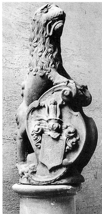
Das Schloss Flaach, ein mehrteiliger Gerichtsherrensitz, der aus einem Fachwerkhaus herauswuchs und im 17. Jahrhundert seine bis heute erhaltene Form fand. Auf dem Hofbrunnen wacht als Wappenhalter seit 1661 ein Löwe.