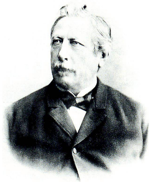
Bundesrat Karl Schenk. Bild aus der «Festgabe auf die Eröffnung des Schweizerischen Landesmuseums in Zürich».