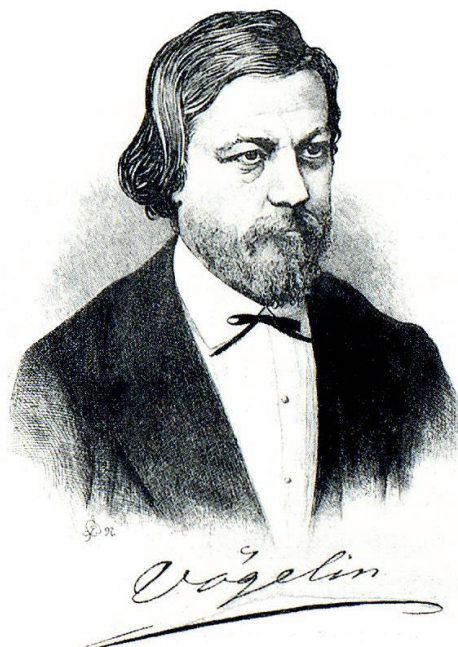
Portrait Salomon Vögelins. Aus der «Festgabe auf die Eröffnung des Schweizerischen Landesmuseums in Zürich».

Bern waren just zu jener Zeit Ausstellungsräume frei geworden, da das Berner naturhistorische Museum einen Neubau bezogen hatte 12 . In seiner Mitteilung mit dem Titel «Confidentiell» berichtete von Büren von den Verhandlungen mit dem steinreichen Friedrich Bürki und von der geplanten Schaffung des historischen Museums in den alten Räumen des naturhistorischen Museums 13 . Den Grundstock der Sammlung sollten die Trophäen aus den Burgunderkriegen und Bürkis Antiquitäten bilden. Ein Erweiterungsbau könne ins Auge ge-