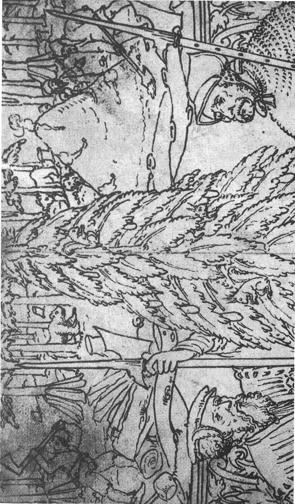
Abb. 8: Köhler bei der Herstellung von Holzkohle: Im Bild rechts ein Kohlenmeiler, links ein Holzspalter, der mit Axt und Bisse die Spalten aufbereitet. Zum Trocknen werden diese Holzspalten rund um einen Baum herum ange stellt. — Ausschnitt aus einem Scheibenriss von Hieronymus Lang, 1556, Antiquarische Gesellschaft in Zürich, AG 12001.