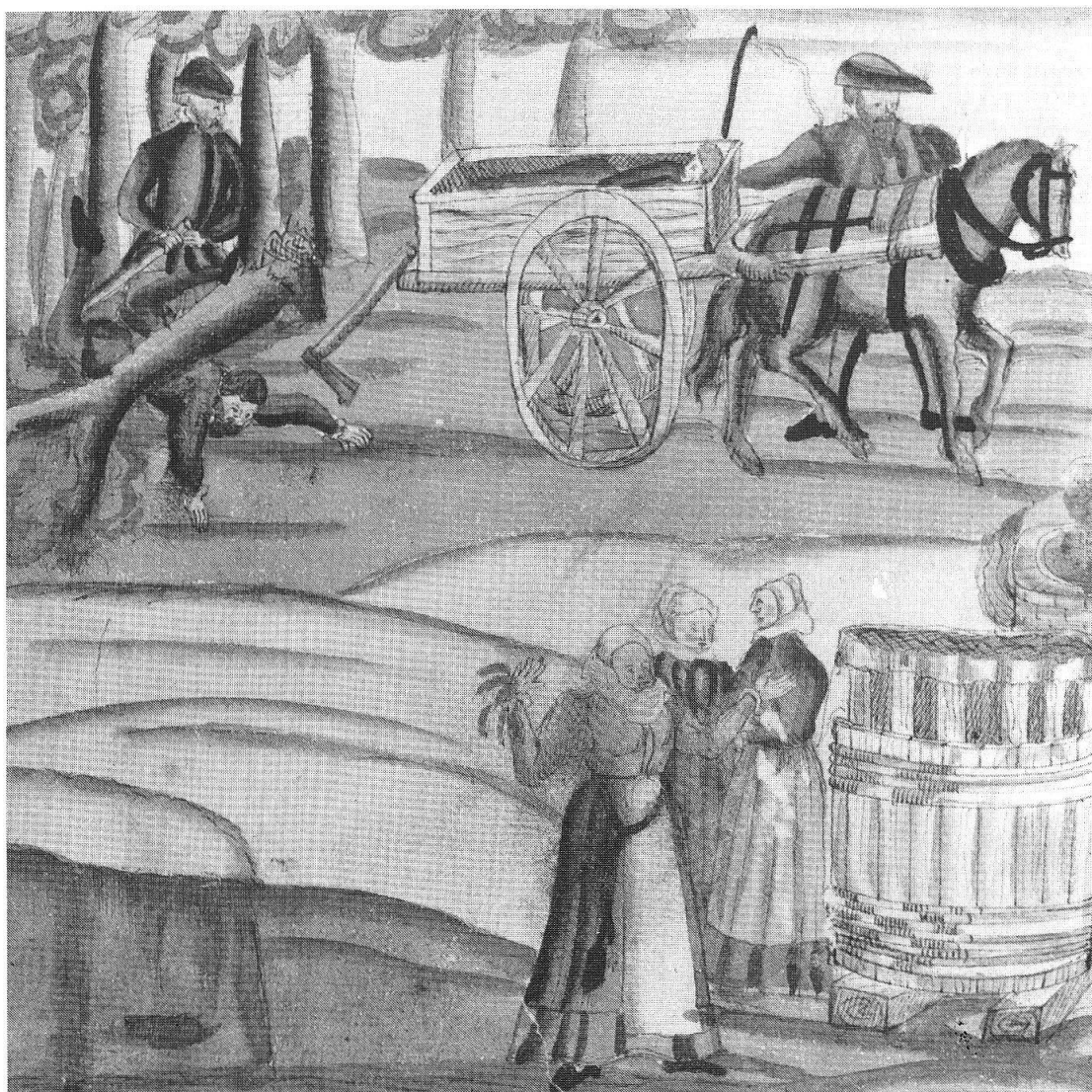
Abb. 7: Verunfallter Holzfäller, 1574. Das Fällen von Bäumen (mit der Axt) war auch im Mittelalter eine der gefährlichsten Arbeiten überhaupt. — Wickiana, F 23, 417, Handschriftenabteilung, Zentralbibliothek Zürich (Photo: ZB).