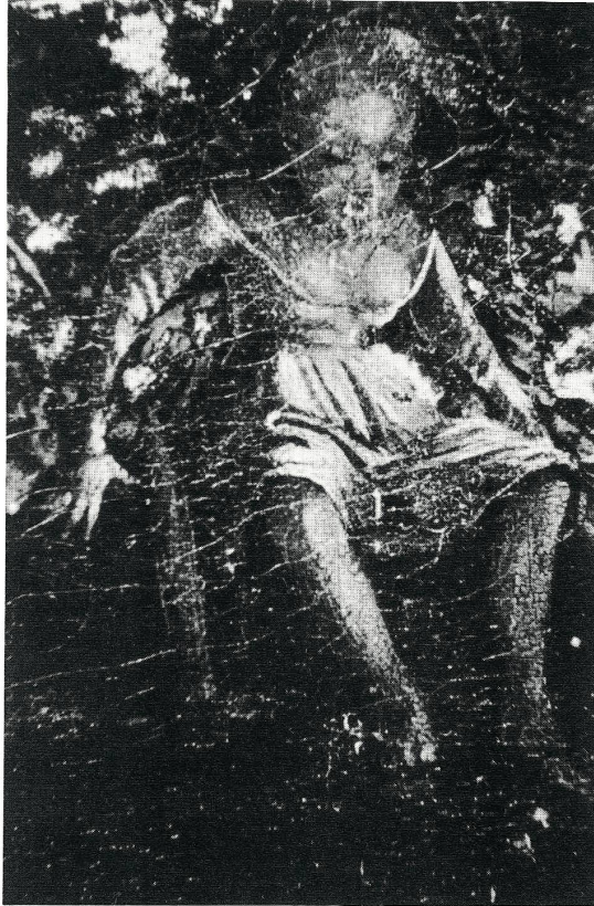
Abb. 132 Mädchen, sich die Füße badend. Detail vom Fischfangbild