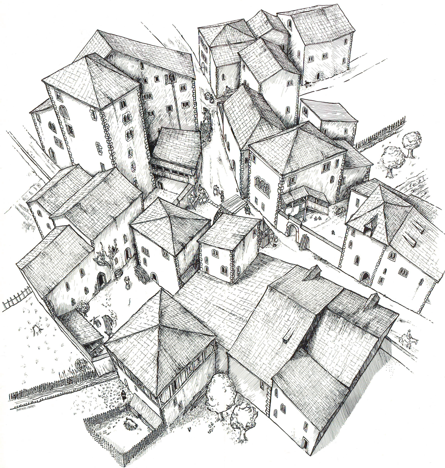
Falttafel 2 Der «höfische Kern» am Rindermarkt/Neumarkt in der zweiten Hälfte des 13. Jahrhunderts. (Zeichnung: Marianne Mathys, Daniel Berti, Zürich)