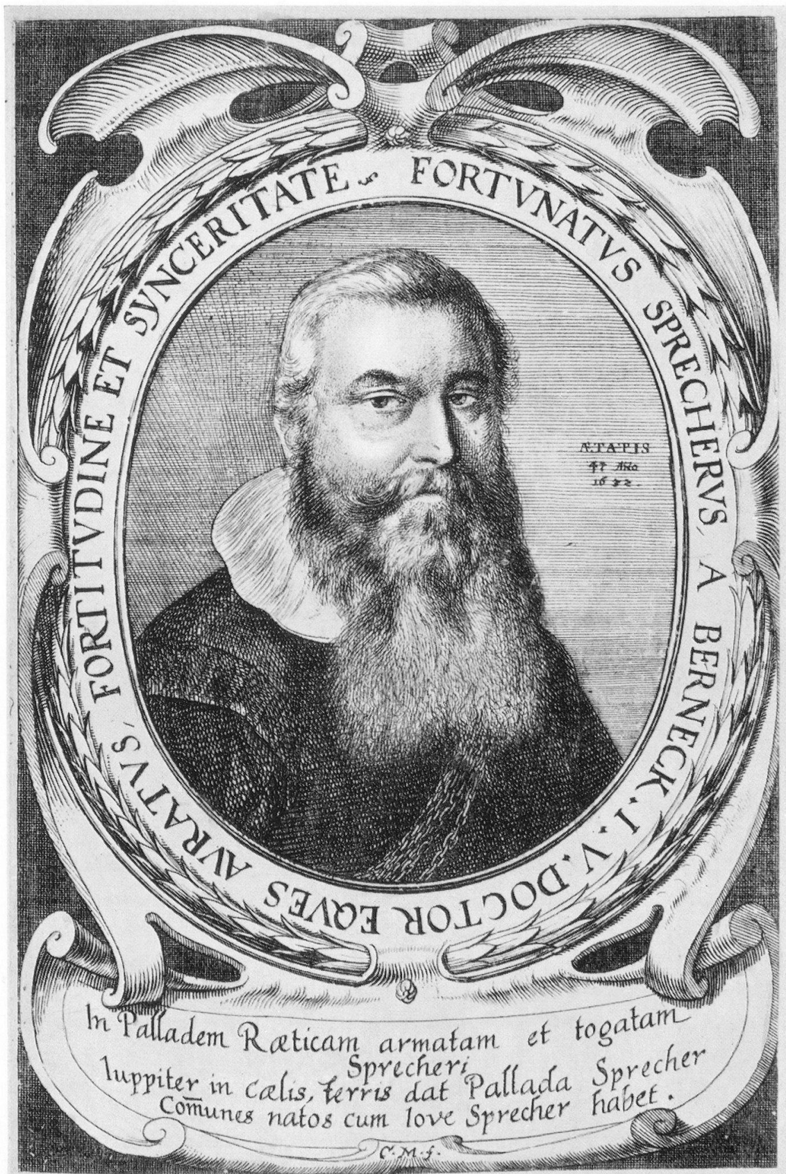
Abb. 3. Fortunat Sprecher