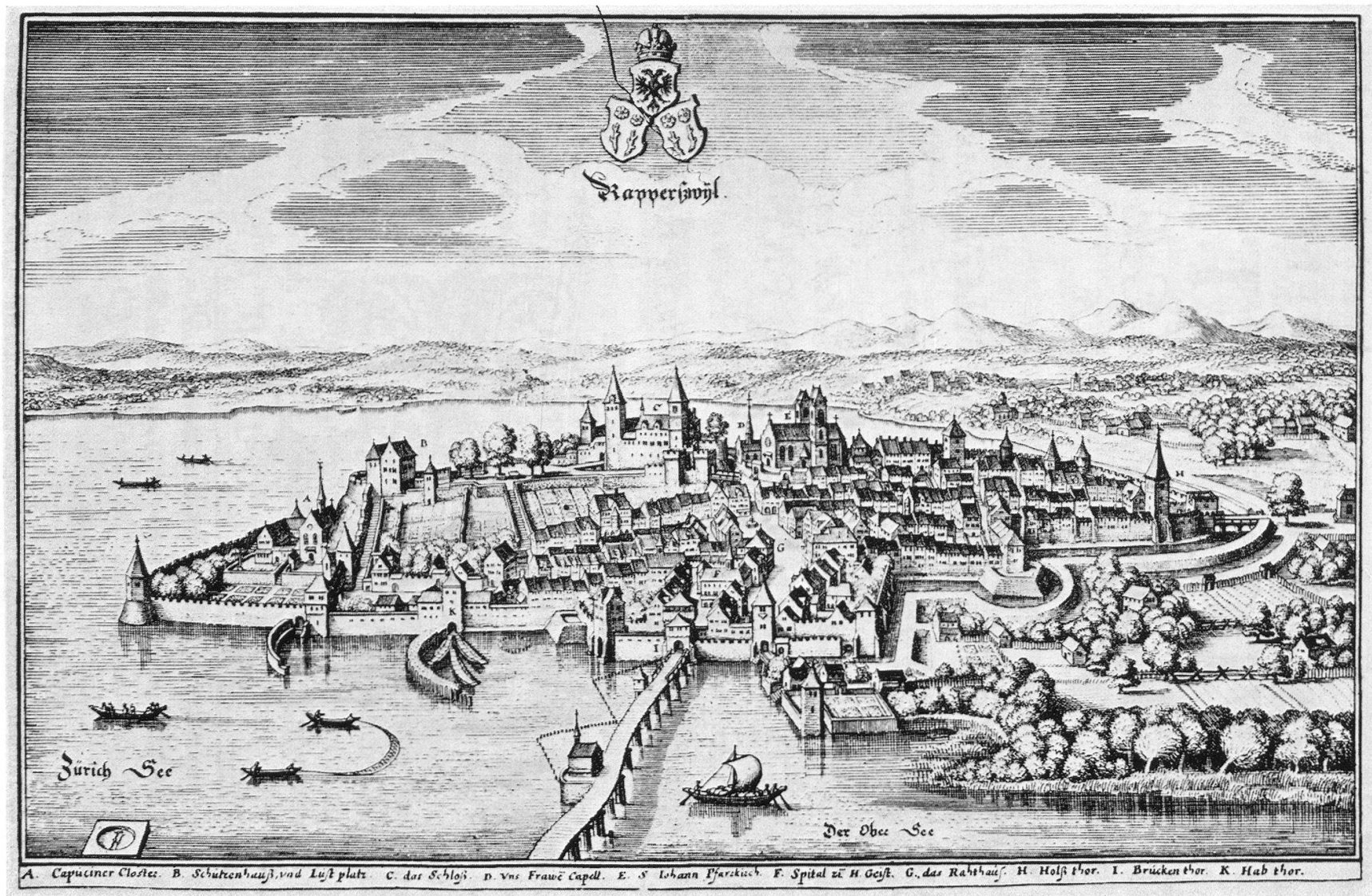
Abb. 5. Rapperswil (Aus der „Topographia Helvetiae, Rhaetiae et Valesiae“ von Matthaeus Merian, 1642)