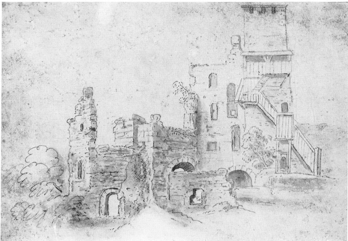
Ruine Alt-Wülflingen um 1710