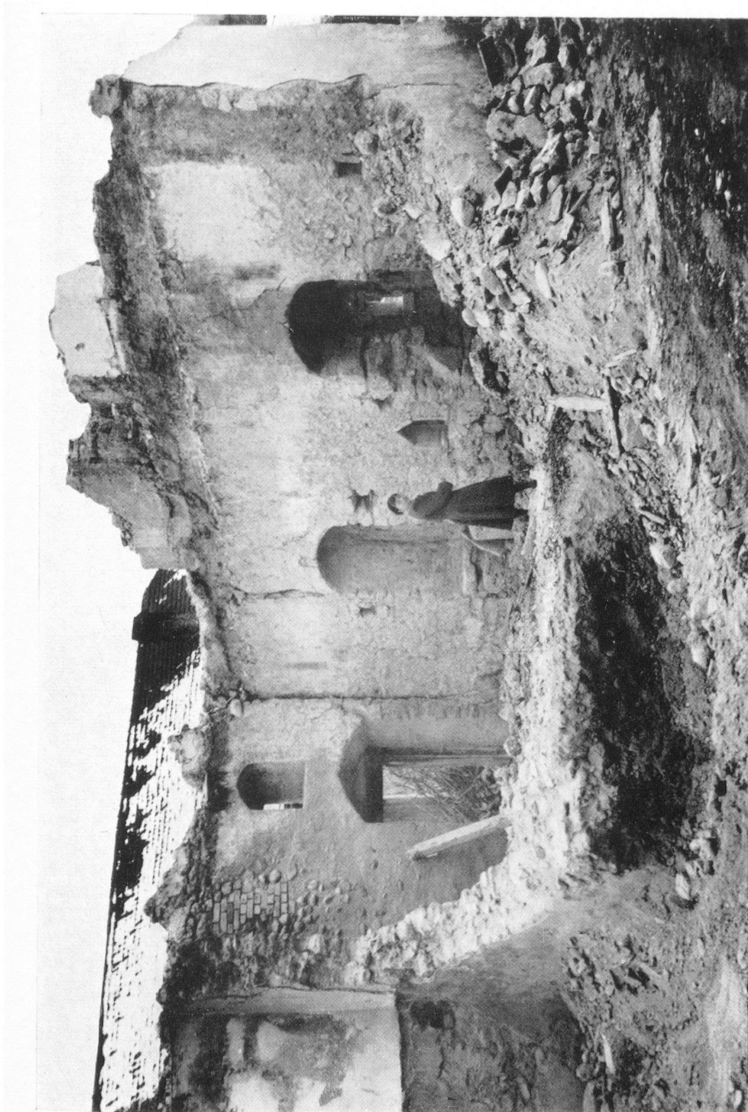
Überreste der Hunfried-Kirche des 11. Jahrhunderts in Embrach, abgebrochen 1955