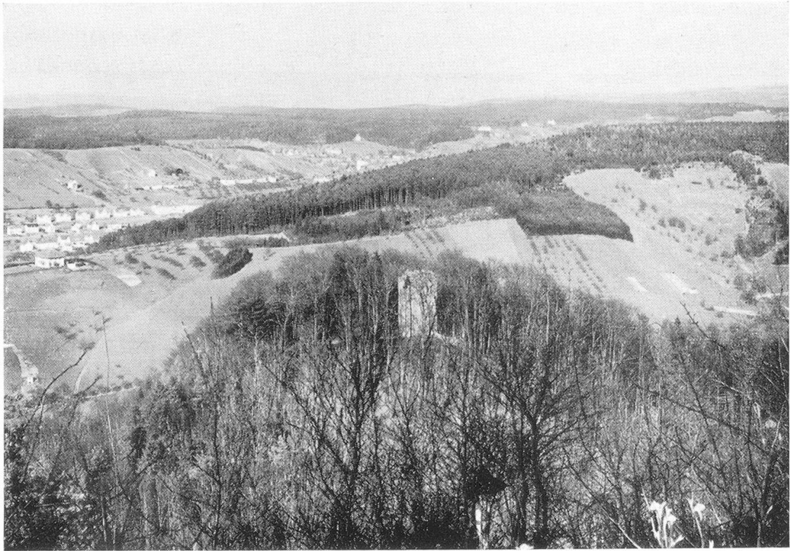
Burghügel und Ruine Alt-Wülflingen