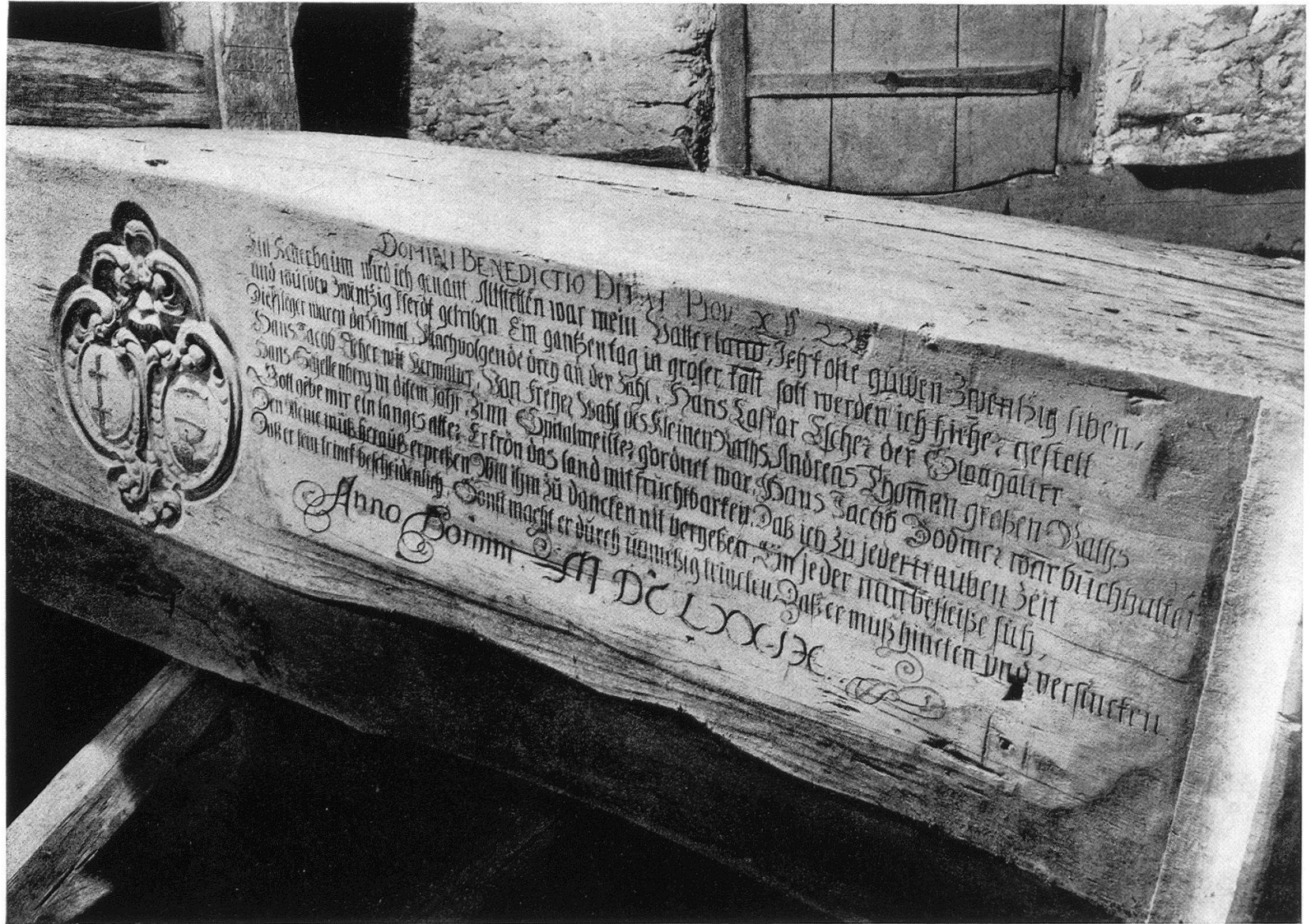
Trotten- spruch in Thalwil aus 1679