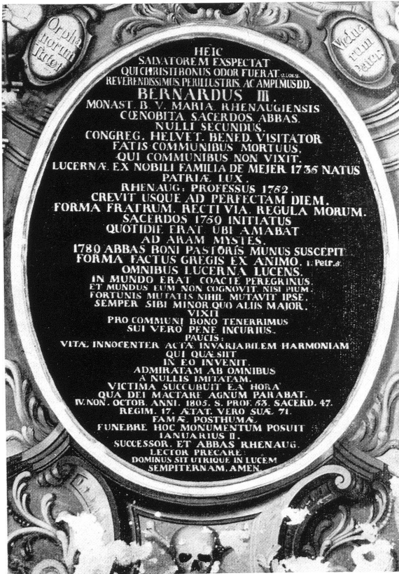
→ Epitaphium in Regensberg aus 1782