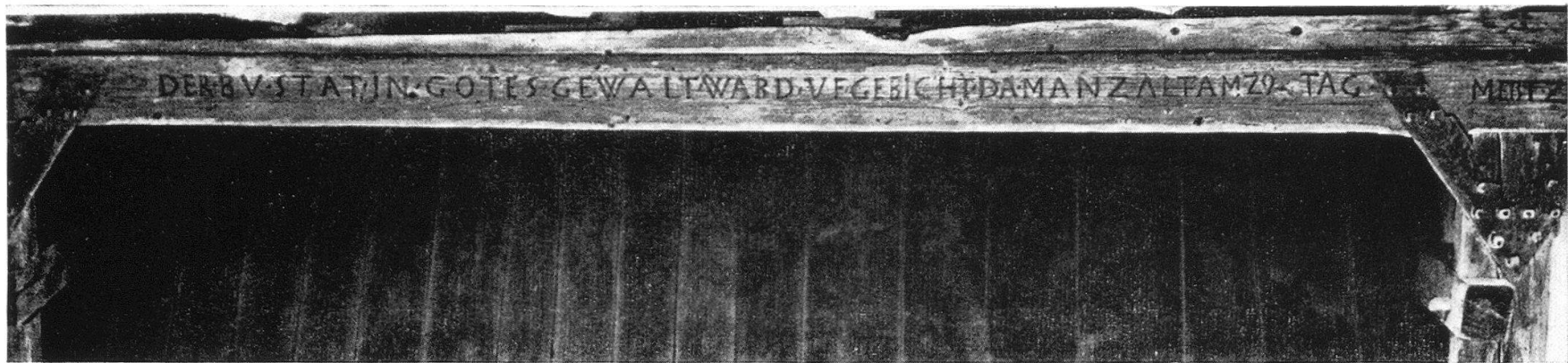
Dachbalken in Tagelswangen aus 1589