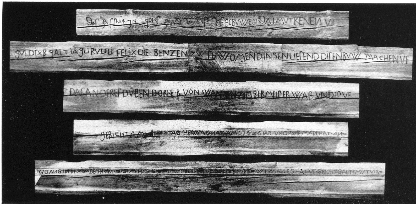
18 m langer Dachbalken in Schwamendingen aus 1626