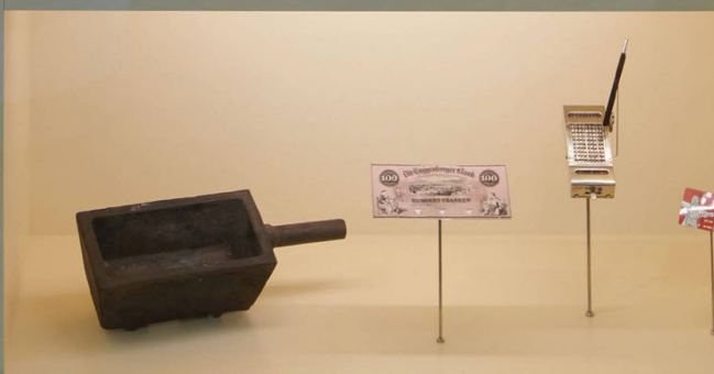
Vue de l'exposition : « La Suisse. C'est quoi? »