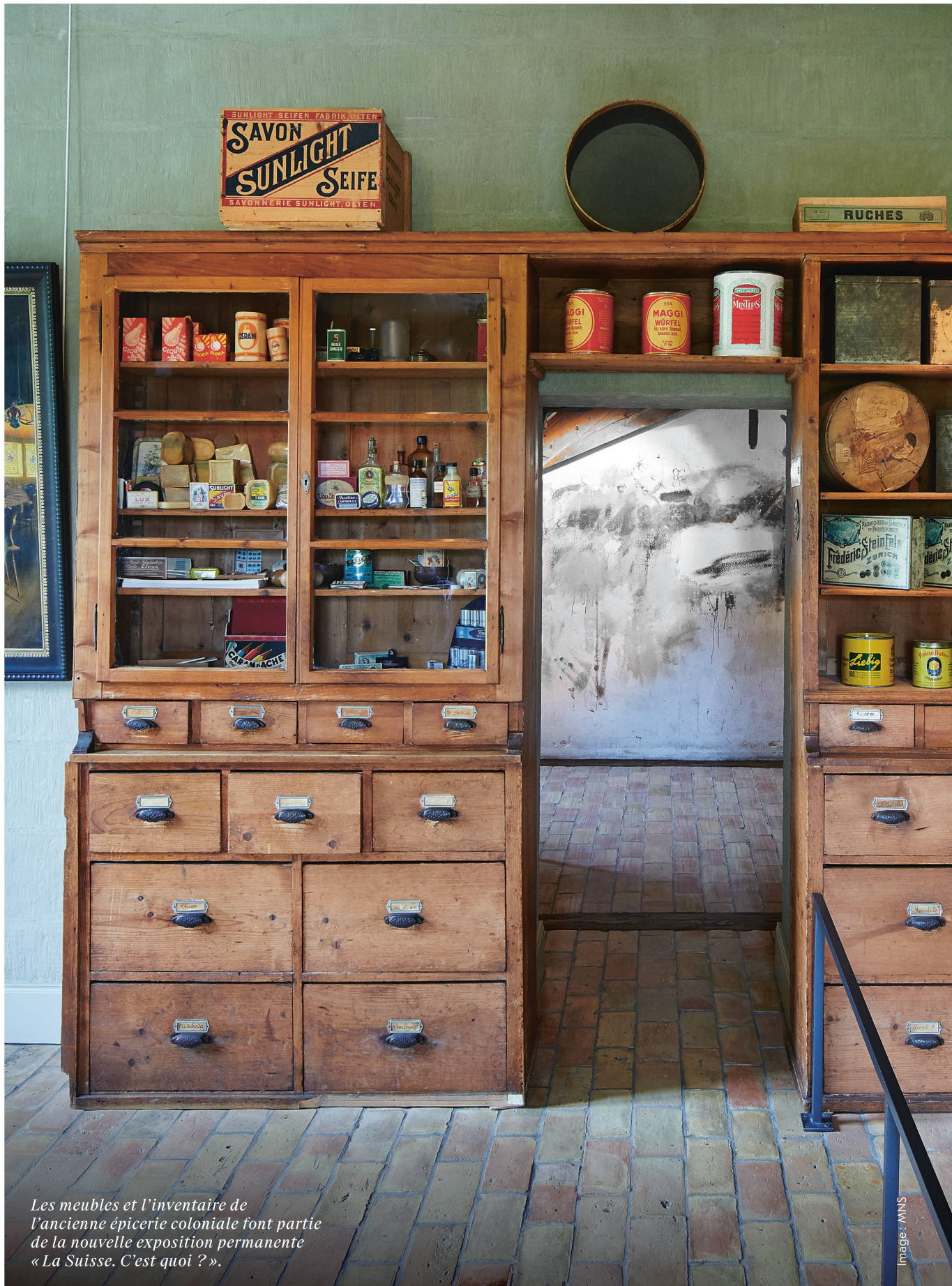
Les meubles et l'inventaire de l'ancienne épicerie coloniale font partie de la nouvelle exposition permanente « La Suisse, C'est quoi ? ».