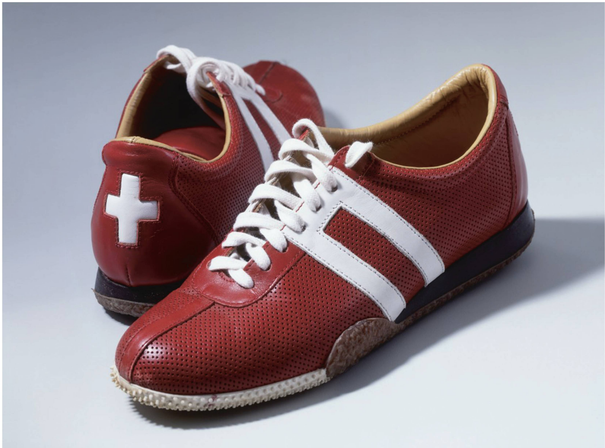
Horloge de gare et chaussures de Micheline Calmy-Rey : symboles de ponctualité et de diplomatie, deux qualités suisses « typiques ».