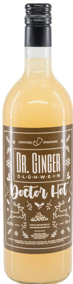
Vin chaud : Dr. Ginger 75 cl/CHF 23.50