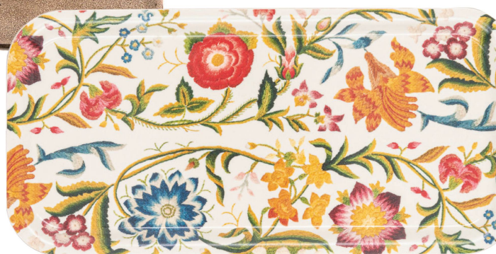
Plateau : Histoires de lits MNS, dessin de Katja Spörri Bois/CHF 27