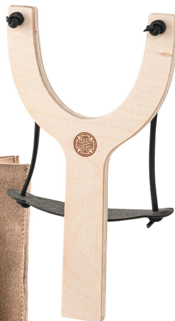
Jouet en bois : Lance-pierre Manufacture de jouets Vah CHF 16.90