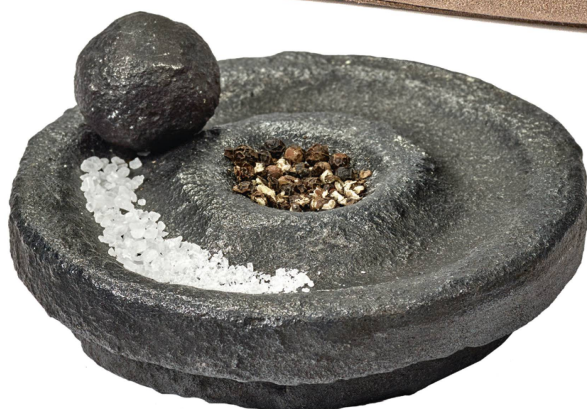
Mortier en fonte : Knutson & Ballouhey valerie_objects CHF 129