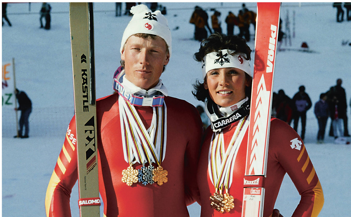
Les médailles remportées par Pirmin Zurbriggen et Maria Walliser en 1987 à Crans-Montana ont renforcé le sentiment d'être une nation du ski.