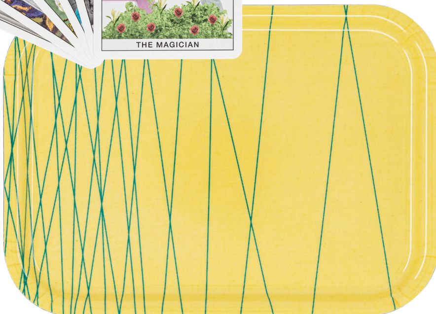
Plateau: B 21011 20 x 28 cm, Matrix / CHF 48