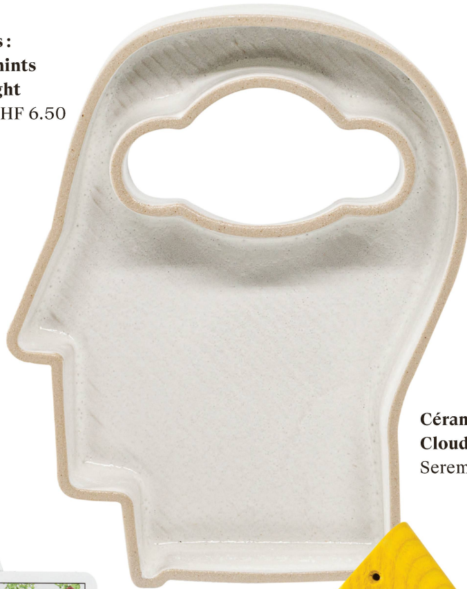
Céramique 3D: Cloud in the Head Seremik / CHF 52