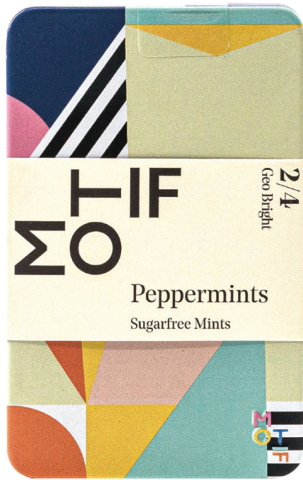
Bonbons: Peppermints Geo Bright Motif / CHF 6.50