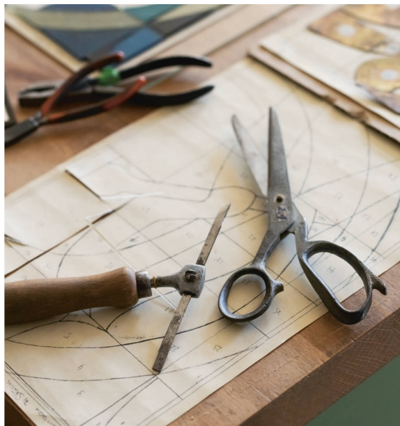
Couteau et ciseau spécial.

Une fois les calibres découpés, le vitrailliste a l'embarras du choix entre plus de 5000 coloris. Pour chaque pièce, il choisit le verre qui convient, comme un peintre choisit ses couleurs. Il ne les fabrique pas lui-même, mais les achète à une verrerie.