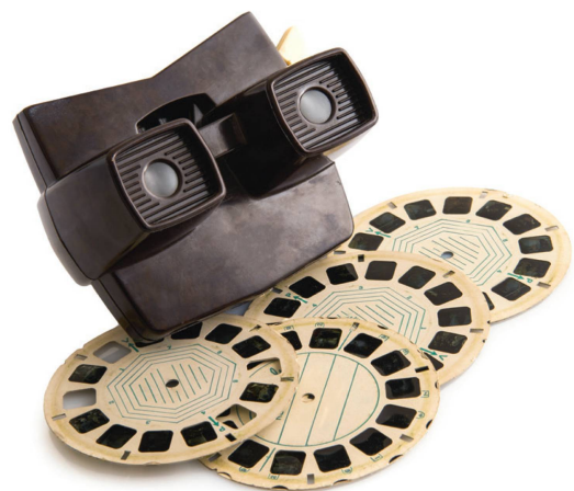
La visionneuse View-Master a conquis les chambres d'enfant dès 1939.

Très vite après son invention, la stéréoscopie, main dans la main avec la photographie mise au point seulement un an plus tard, se mue en un média de masse qui conquiert la planète. Cette ascension est principalement le fait d'éditeurs