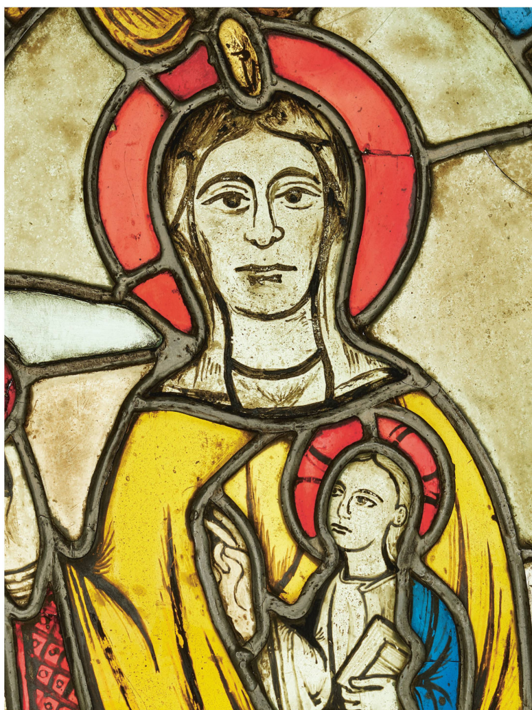
Vitrail datant du Moyen Âge : la Vierge à l'Enfant, aux alentours de 1200, chapelle de Saint-Jacques, à Gräpplang, Flums (SG).

Le vitrailliste travaille sur la base d'idées personnelles ou de modèles faits par d'autres artistes. Il élabore une maquette, qui est ensuite reportée sur un calque épais, le carton. Chaque pièce est dessinée et numérotée pour ne pas être confondue. Les « calibres » sont ensuite découpés à l'aide d'un ciseau spécial qui retire des bandes de 1,5 millimètre de large entre les morceaux. C'est dans cet espace que le sertissage en plomb, qui constitue le cadre si caractéristique des vitraux, prend place.