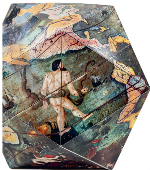
Maquette: Globe de Saint-Gall Zentralbibliothek Zürich / CHF 3