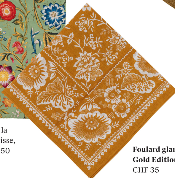
Foulard glaronnais : Gold Edition CHF 35