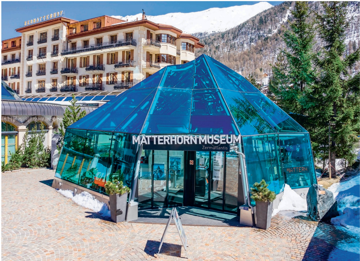
L'entrée de l'exposition au sous-sol évoque un cristal de roche.

Le Musée du Cervin, à Zermatt, propose une immersion dans le passé du petit village de montagne et de son plus illustre sommet.