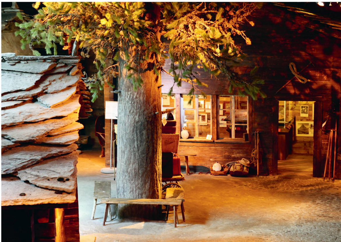
La visite est organisée autour de la réplique de la place du village historique.