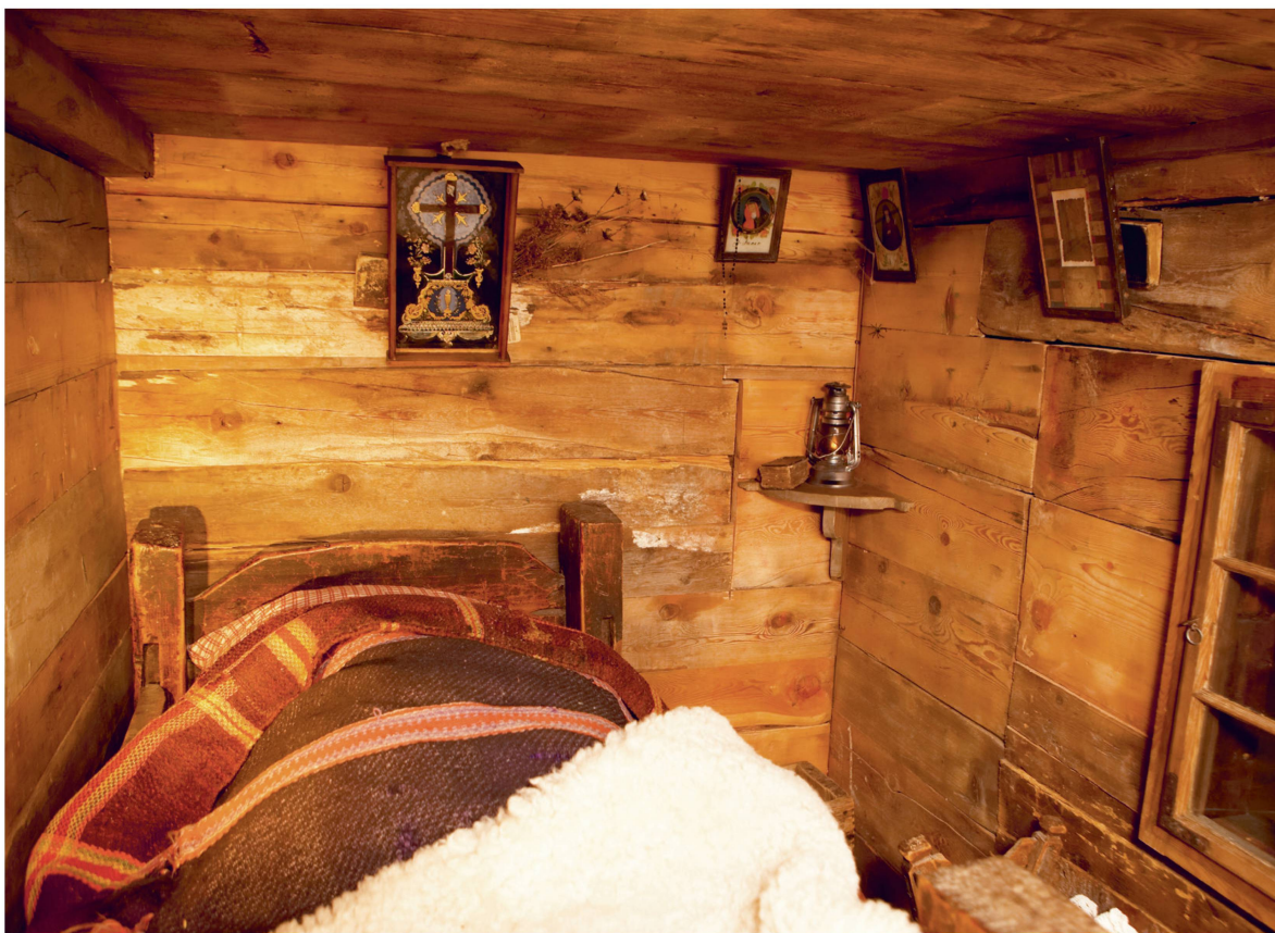
L'aménagement livre un aperçu de la vie de la population de Zermatt au XIX e siècle.