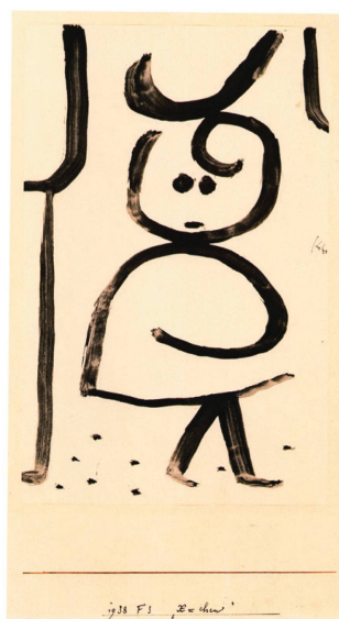
Paul Klee, Xchen (1938).