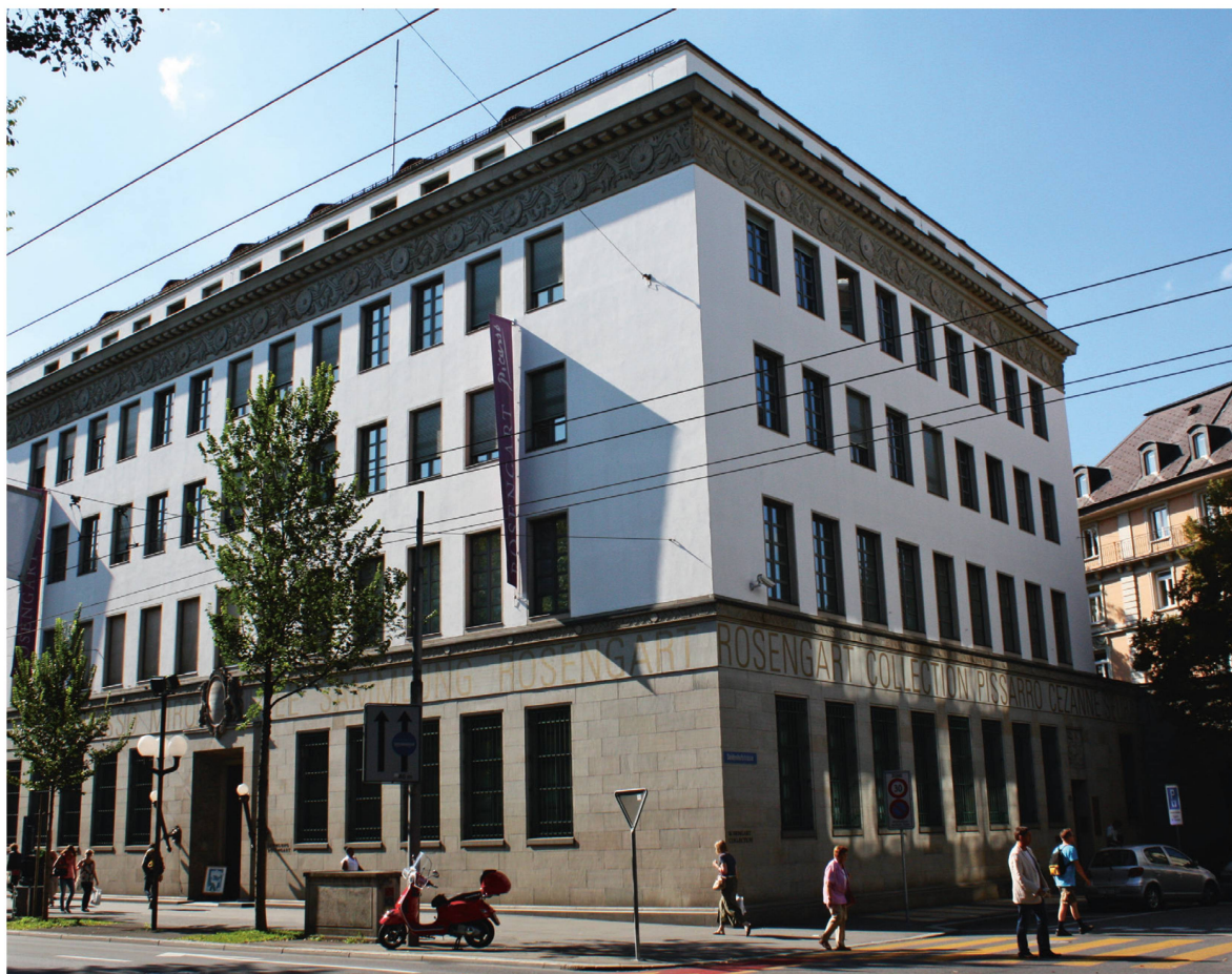
La collection a trouvé un abri idéal : l'ancien bâtiment de la Banque nationale.

Xchen a lui aussi trouvé sa place dans l'ancienne banque : tout au fond, au sous-sol, où il est en excellente compagnie, entouré de travaux ultérieurs de Klee.