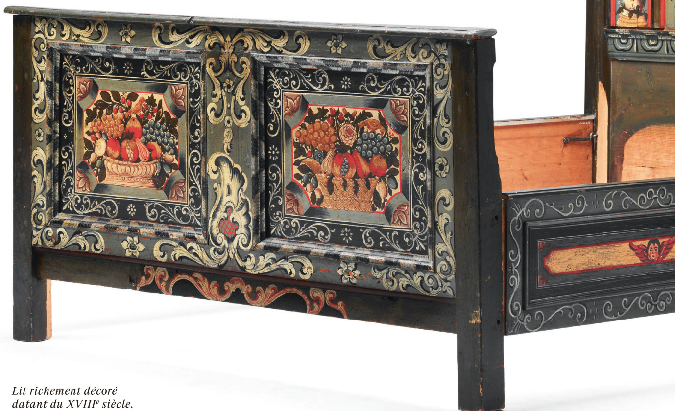
Lit richement décoré datant du XVIII e siècle.

Même si la Confédération n'eut jamais de roi à sa tête, le faste monarchique et les mises en scène prestigieuses entre les murs de la chambre à coucher se répandirent dans les riches maisons bourgeoises. On exhibait volontiers le savoir-faire d'un artisan pour impressionner les visiteurs. Fort heureusement, nombre de ces objets ont été conservés et font désormais partie des collections du Musée national suisse.