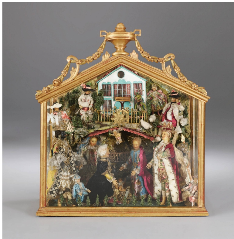
Crèche-vitrine avec figurines en cire provenant du cloître de Hermetschwil. Dernier quart du XVIII e siècle, chapitre de Beromünster.

Au centre, on reconnaît l'Adoration des Mages. Ils portent des manteaux de velours, doublés de fourrure et décorés de paillettes