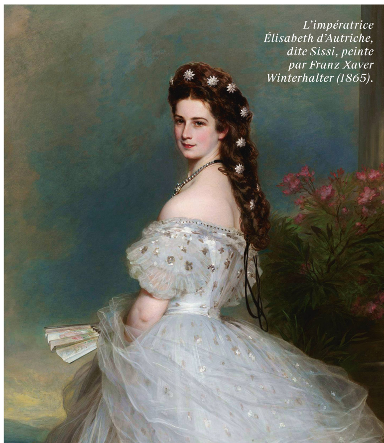
L'impératrice Élisabeth d'Autriche, dite Sissi, peinte par Franz Xaver Winterhalter (1865).

Sissi s'essaya aussi à la poésie. Elle vouait une grande admi-