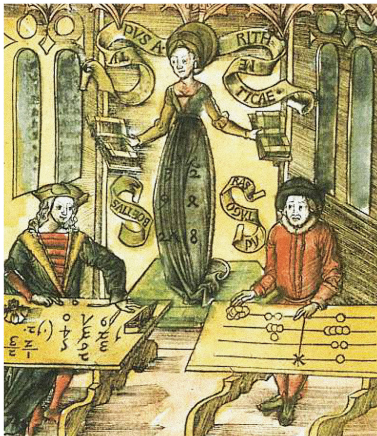
Le triomphe des chiffres arabes sur les chiffres romains à la table de calcul (Margarita Philosophica, 1504).

Le système que Fibonacci rapporte en Italie met du temps