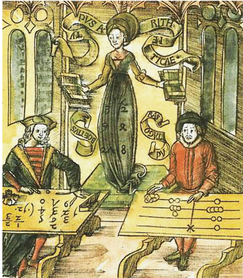
Le triomphe des chiffres arabes sur les chiffres romains à la table de calcul (Margarita Philosophica, 1504).

Le système que Fibonacci rapporte en Italie met du temps