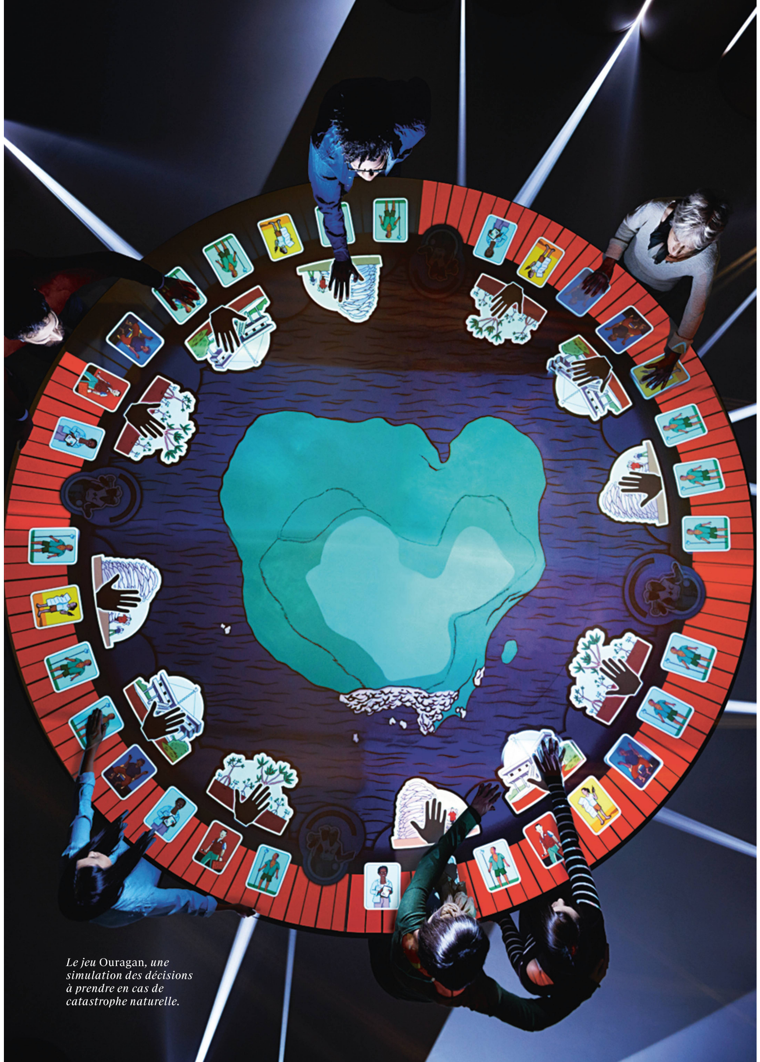
Le jeu Ouragan, une simulation des décisions à prendre en cas de catastrophe naturelle.