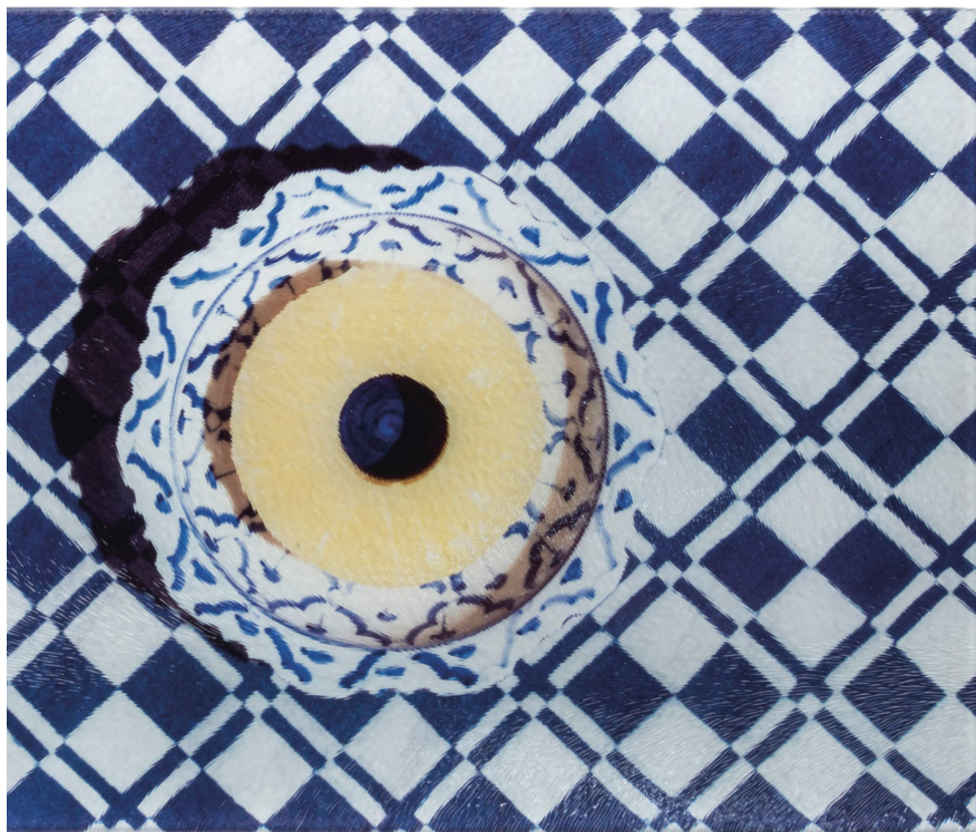
Planche à découper : Ananas Isabel Rotzler, verre, 28,5×20 cm / CHF 49

Capuchon : Beige 100 % mérinos, div. couleurs / CHF 125