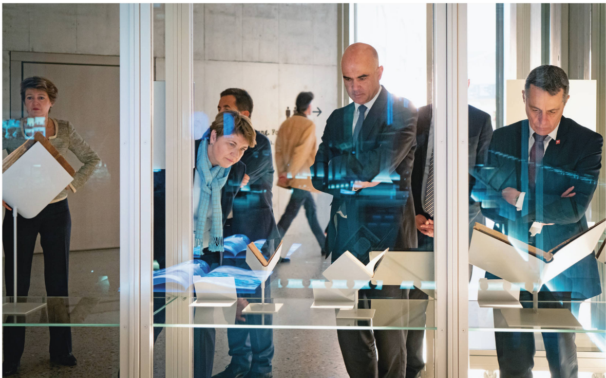
L'exposition permanente « Idées de la Suisse » a particulièrement plu au gouvernement.