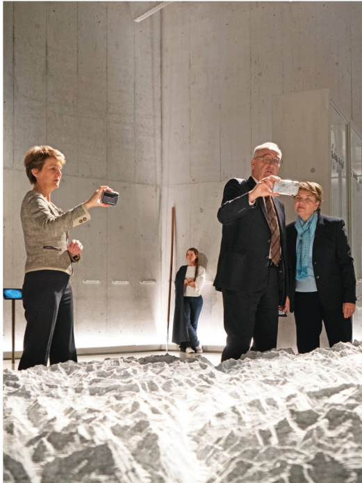
Les possibilités interactives ont exercé leurs charmes (numériques) sur le gouvernement aussi.