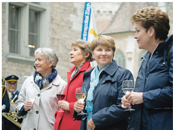
Women power : lors de sa visite à Zurich, le Conseil fédéral a montré son côté féminin. La population a apprécié cela.