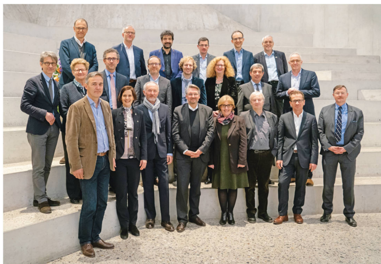
Concentré d'histoire : au printemps, les directrices et directeurs de musées historiques de l'Europe germanophone se sont réunis à Zurich.

Le Musée national suisse reçoit régulièrement la visite de personnalités.