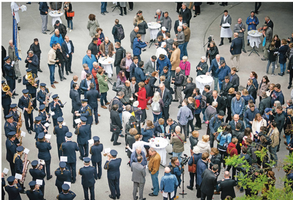
Après la séance, ses membres sont allés à la rencontre de la population dans la cour du musée.