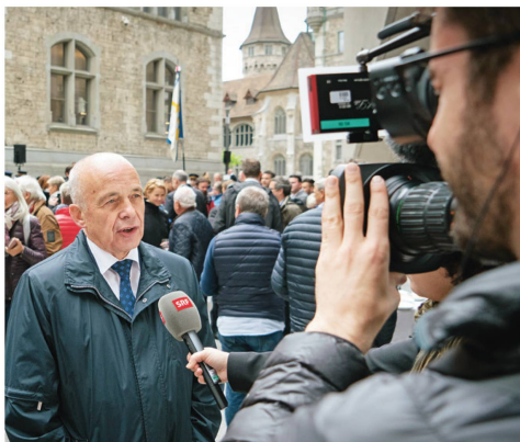
Zurichois, le président de la Confédération Ueli Maurer était particulièrement sous les feux des médias.