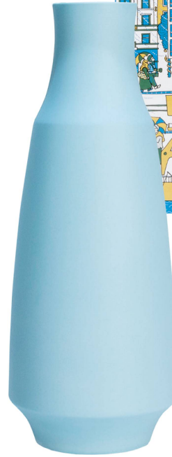
Bouteille bleu : Therese Müller Keramikwerkstatt Porcelaine / CHF 180