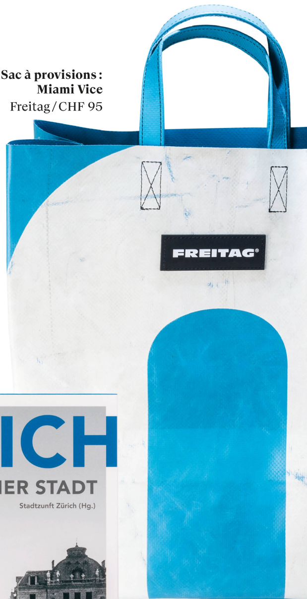
Sac à provisions : Miami Vice Freitag / CHF 95