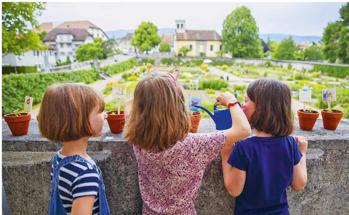
Le Rendez-vous au jardin sera aussi une source de plaisir pour les jeunes visiteurs.