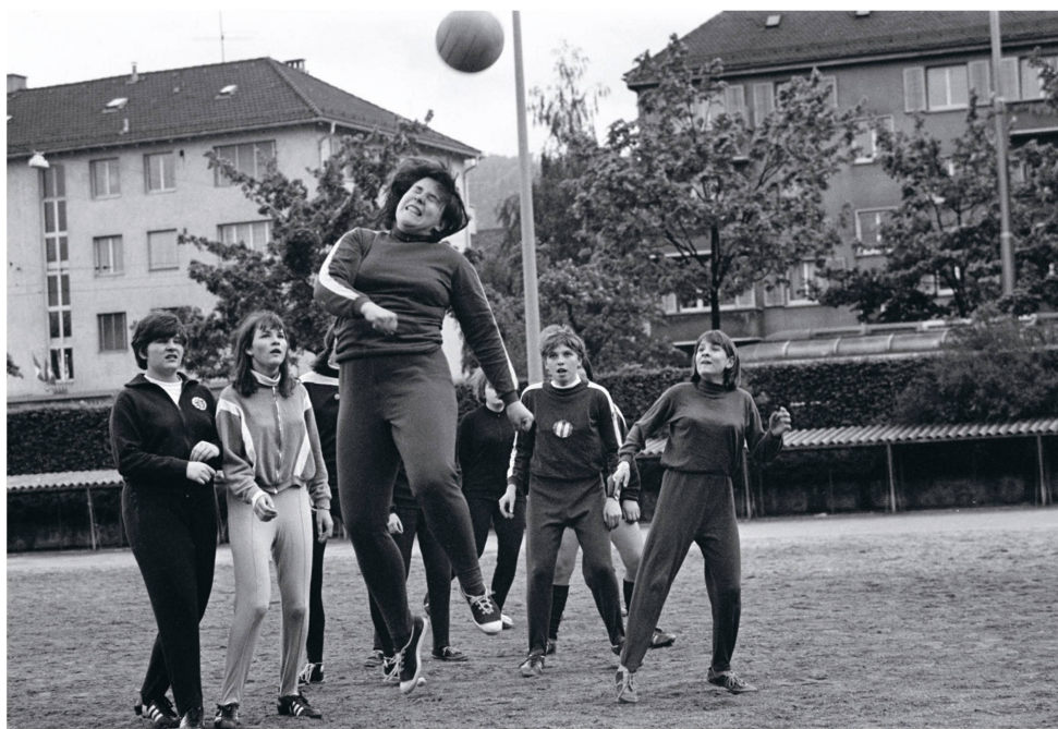
Photo issue d'un reportage sur le « Damen-Fussball-Club Zürich », mars 1968.