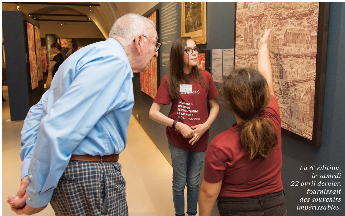
La 6 e édition, le samedi 22 avril dernier, fournissait des souvenirs impérissables.

U ne époque commentée avec les yeux de demain», voilà un témoignage laissé dans le livre d'or du musée qui résume parfaitement cette action menée depuis 2013 au Château de Prangins. Mais qu'en est-il exactement ?