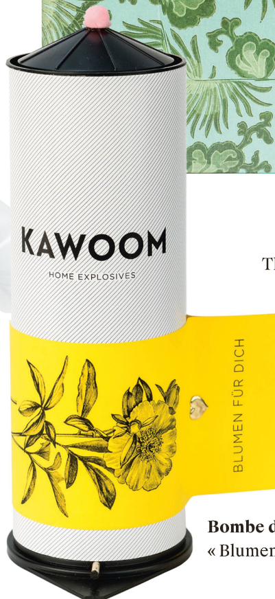
Bombe de table : KAWOOM « Blumen für Dich » / CHF 32