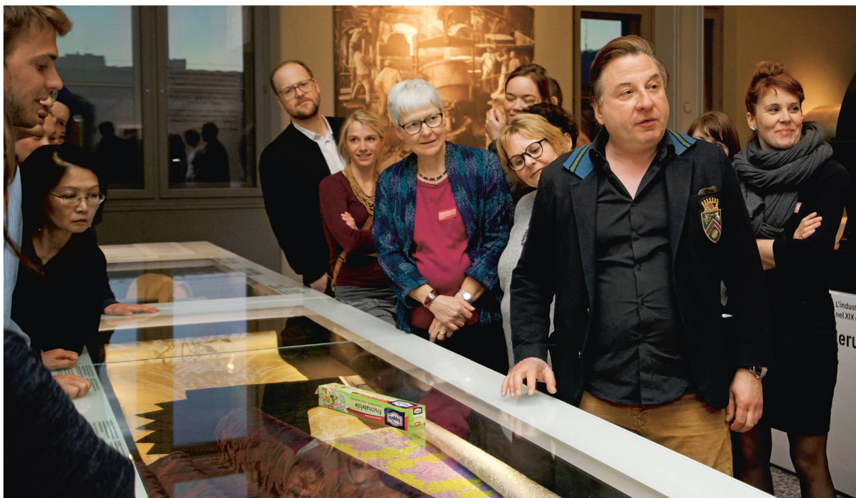
Dans le cadre du cycle de manifestations Lakritz d'avril, Beat Schlatter, à la fois acteur et comique, a joué le guide de l'exposition permanente « Histoire de la Suisse » et présenté les plus grandes inventions nationales à un public séduit par son humour corrosif.