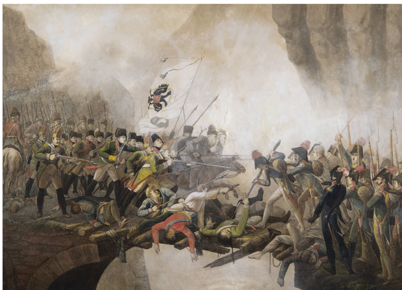
Combat sur le Pont du Diable; vers 1800, anonyme, papier.

En Suisse centrale, l'épopée de Souvorov à travers les Alpes est aujourd'hui encore ancrée dans