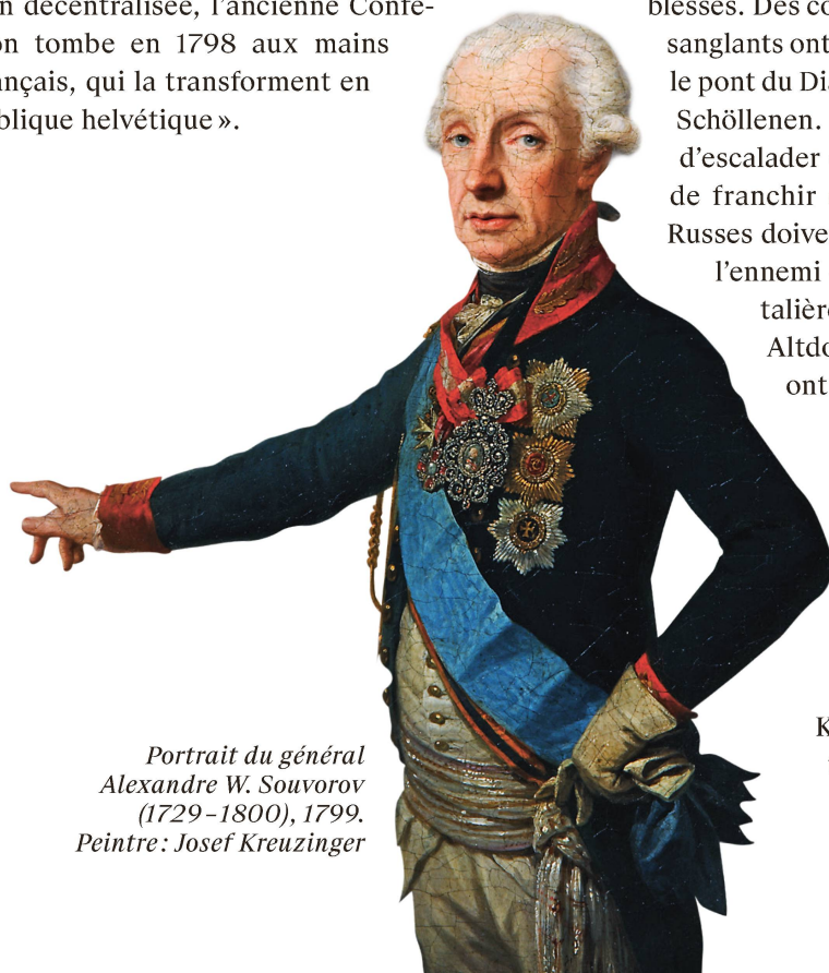
Portrait du général Alexandre W. Souvorov (1729-1800), 1799. Peintre: Josef Kreuzinger

Les troupes françaises ayant réquisitionné tous les bateaux mouillant à Altdorf, Souvorov est contraint de modifier ses plans et de se réfugier à Schwytz via le col du Kinzig. Entre le 27 septembre et le 4 octobre, la Muotatal voit s'opposer des milliers de Russes