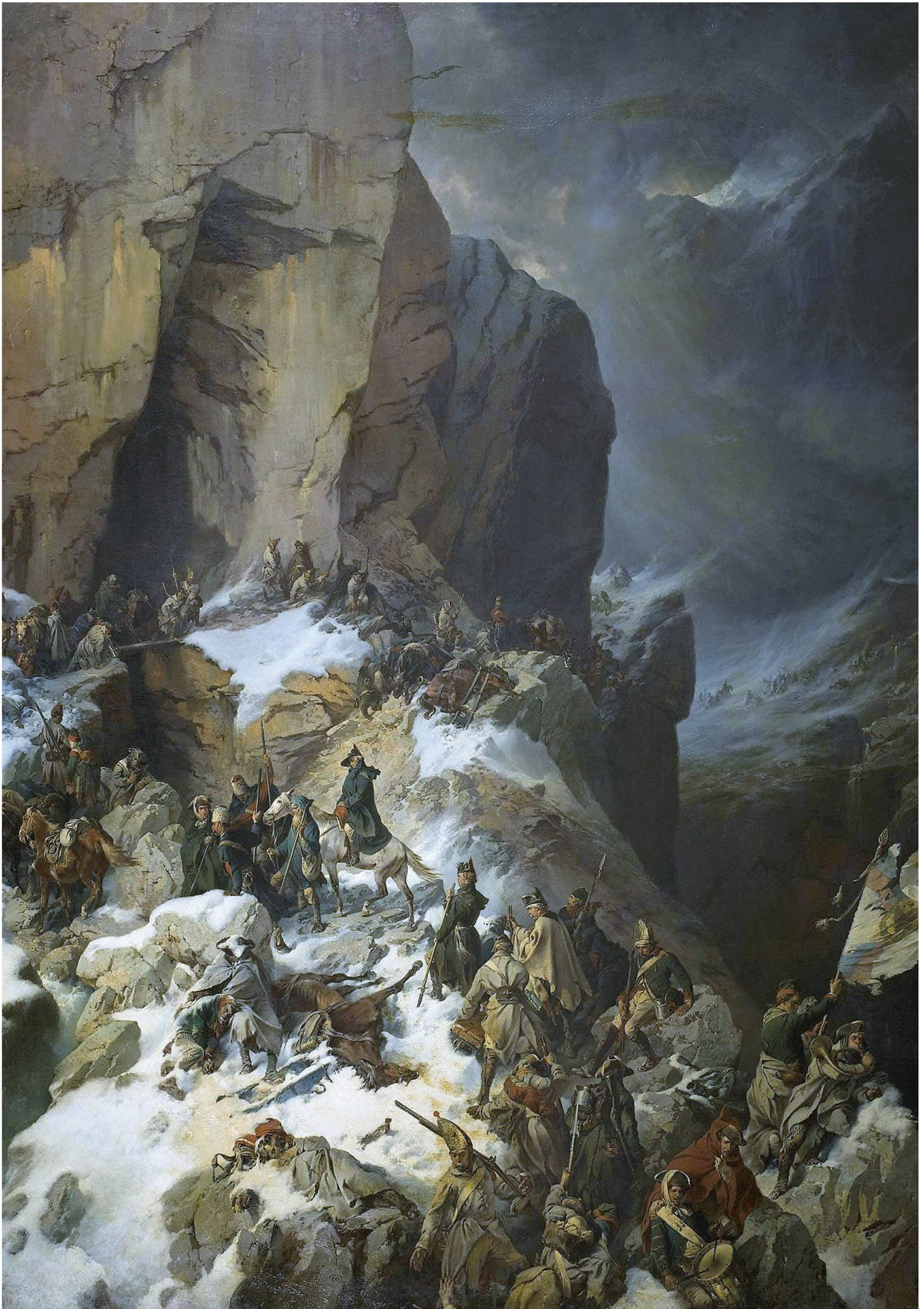
Souvorov traverse le col enneigé du Panix; peinture 1860, Alexander von Kotzebue.