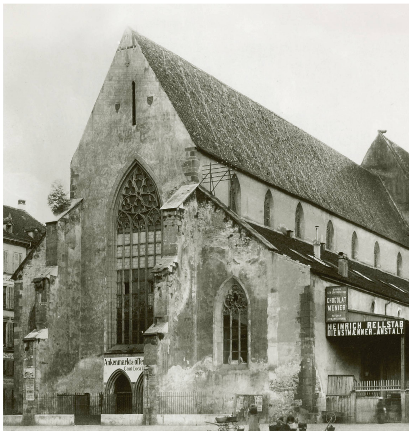
Vers 1890, la Barfüsserkerche servait de marché au beurre («Ankenmarkt»).