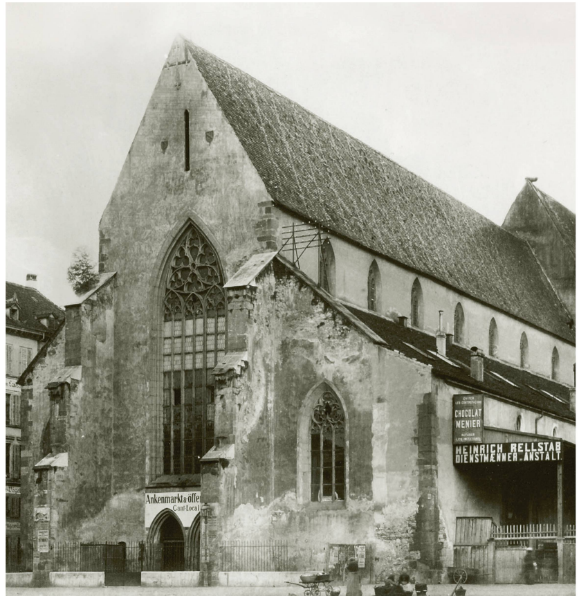
Vers 1890, la Barfüsserkirche servait de marché au beurre («Ankenmarkt»).