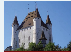
Le Château de Thoune – Le château-musée

Le Château de Spiez et sa chapelle romantique sont situés sur une petite presqu'île entourée du Lac de Thoune et de montagnes. La nouvelle exposition permanente donne un aperçu de 1300 ans d'histoire. Exposition spéciale 2017: «Bergzauber und Wurzelspuk – Ernst Kreidolf (1863 – 1956) und die Alpen».