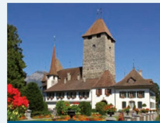
Le Château de Spiez – art et histoire

Situation inoubliable au bord de l'eau, vue époustouflante. Cuisine raffinée et service accueillant du petit-déjeuner au dîner. Un musée y retrace l'histoire de la gastronomie.