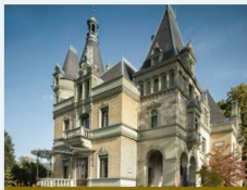
Le Château de Hünegg – un palais de conte de fées au bord du Lac de Thoune

Les châteaux du bord du Lac de Thoune – une excursion dans des temps oubliés