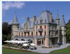
Le Château de Schadau – perle au bord du Lac de Thoune

Huit siècles d'histoire sont à découvrir à l'intérieur du Château d'Oberhofen. Le parc du château est un des plus prestigieux jardins de la région alpine et invite à y jouir des instants de détente. Le fumoir oriental, construit en 1855 tout en haut dans le donjon, dégage une ambiance unique. Nouvelle exposition à partir du 6 juin 2017: «Toujours à votre service!» – dans l'aile des domestiques du 19 ème siècle.