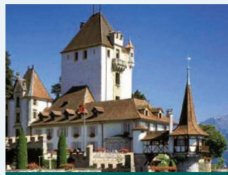
Le Château de Oberhofen – magie de huit siècles

Le Château de Hünegg à Hilterfingen est situé dans un magnifique parc avec vue sur les alpes. On peut y admirer ses intérieurs du style «art nouveau» datant de 1900, dont les décors sont restés inchangés depuis.