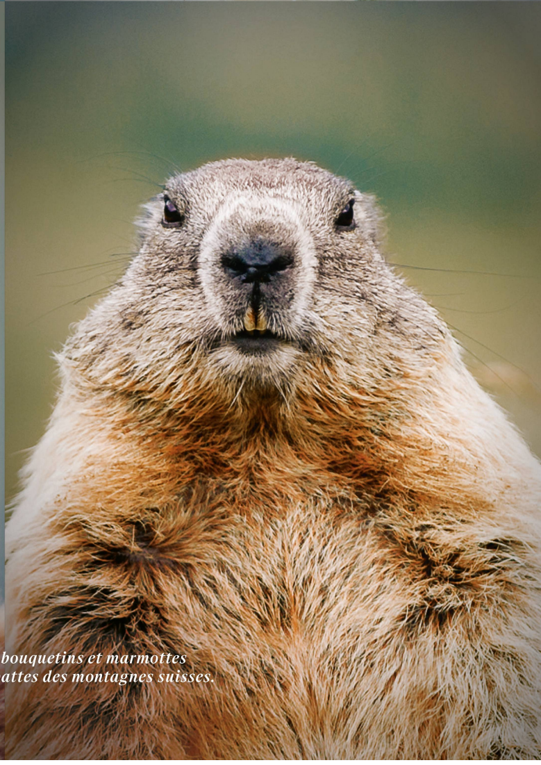
Vaches, saint-bernard, bouquetins et marmottes sont les vedettes à quatre pattes des montagnes suisses.