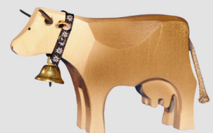
VACHE L'amie chaleureuse

«Si, la vache a entièrement raison», lance un saint-bernard orange et blanc, qui s'avance d'un pas de sénateur vers les trois polémistes tout en clignant de ses yeux larmoyants. «Jusqu'au début du XIX e siècle, tu avais quasi disparu de Suisse,